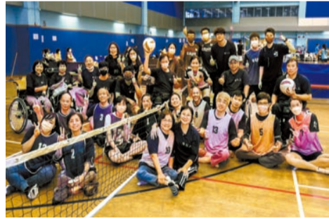
肢體殘障人士參與樂融盃香港輕排球賽。

除了擁有輕排球的特點，坐地輕排球更因應肢體殘疾人士作出改進，具有易學習及對體能要求低等特點。多項數據顯示，參與者通過參加坐地輕排球運動，可提升社交及心理健康，對建立肢障人士的互動、聯繫、合作，產生積極作用。在體能上，該運動能改善包括心血管系統，還能減少體脂，增加參與者對體育活動的享受。另一個重要的坐地輕排球特色是它的共融性，在場