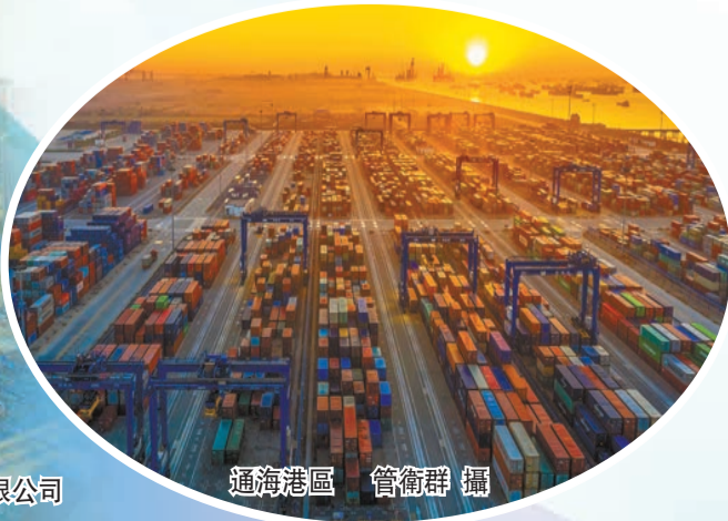
通海港區