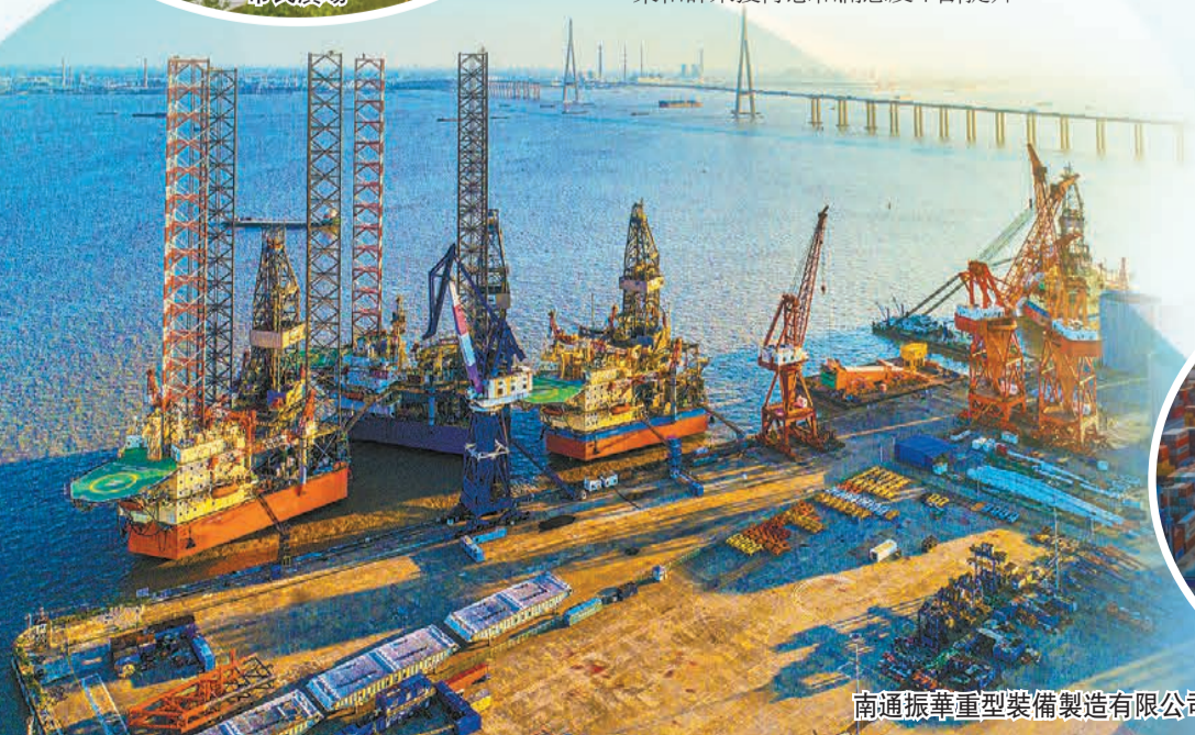
南通振華重型裝備製造有限公司