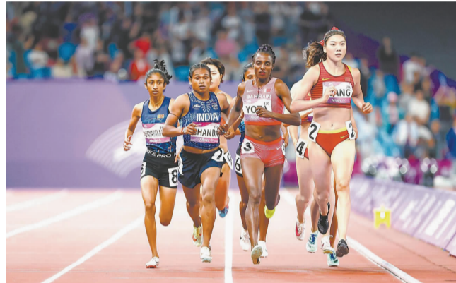
10月4日,安徽名将王春雨(2号)在杭州亚运会田径女子800米决赛中。