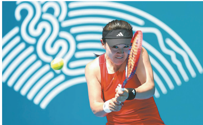
9月29日,安徽“金花”朱琳在杭州亚运会网球女子单打决赛中,为安徽赢得首枚亚运会网球银牌。