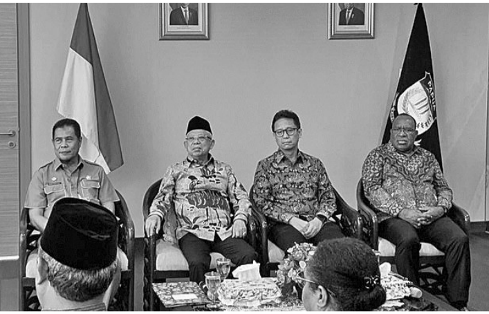
马鲁夫副总统(左二)阐述与巴布亚教会团契对话结果

马鲁夫·阿敏副总统与巴布亚、西巴布亚教会联合会(PGG)和巴布亚基督教中心(PCC)举行对话。