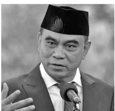
通信与资讯部长布迪·阿里·史提亚迪

规,该法令是印度尼西亚共和国2001年第20号关于修正关于消除腐败罪行的修订法令。(亮剑)