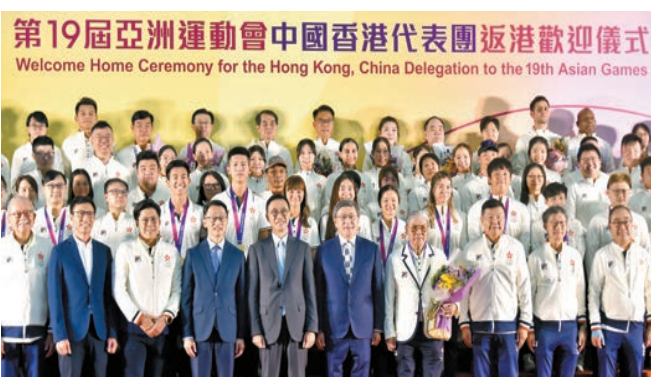
10月9日，特區政府在機場舉行儀式，歡迎亞運港隊凱旋。

香港隊在賽場上取得累累碩果，除了運動員自身永不言棄的拼搏精神和日以繼夜的訓練努力之外，亦少不了香港政府對青年運動員的持續關注和支持，這無疑起到了積極的推動作用。一直以來，港府致力於培訓精英運動員，為本地精英運動員提供直接財政資助及全面支援服務，並不斷投資完善體育場地設施配套，舉辦不同類型的賽事，打造香港成為國際體育盛事之都，不遺餘力地全方位推動香港體育發展，包括連同體育界、學界和商界等等通力合作。早前行政長官李家超會見傳媒時亦表示，本年度體育方面預算開支較五年前增逾四成至近74億元，政策聚焦五方面推廣，即