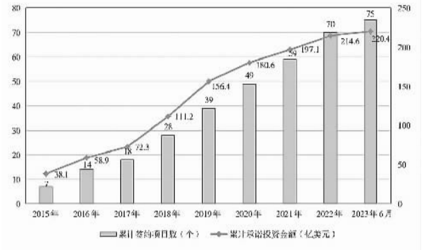
图3 2015年以来丝路基金历年累计签约项目数和承诺投资金额

行、中国进出口银行分别设立“一带一路”专项贷款,集中资源加大对共建“一带一路”的融资支持。截至2022年底,中国国家开发银行已直接为1300多个“一带一路”项目提供了优质金融服务,有效发挥了开发性金融引领、汇聚境内外各类资金共同参与共建“一带一路”的融资先导作用;中国进出口银行“一带一路”贷款余额达2.2万亿元,覆盖超过130个共建国家,贷款项目累计拉动投资4000多亿美元,带动贸易超过2万亿美元。中国信保充分发挥出口信用保险政策性职能,积极为共建“一带一路”提供综合保障。