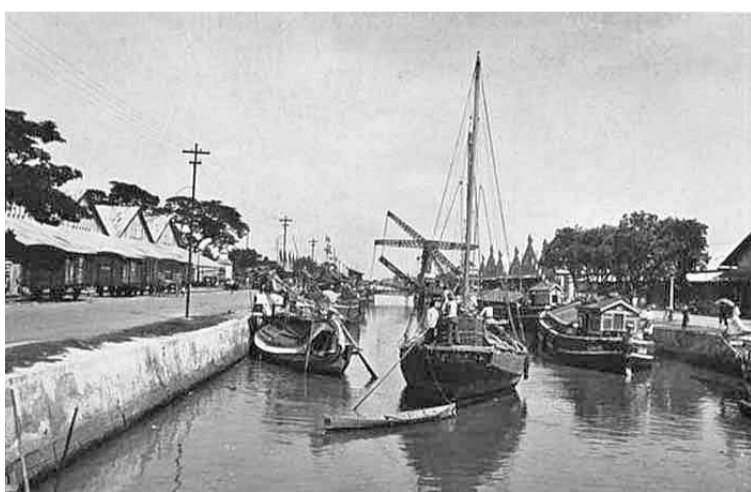
荷兰东印度公司殖民时代的码头

荷兰东印度公司在1796年解散后，荷兰政府控制了印度尼西亚，随后将其称为荷兰东印度。基于荷兰的经济利益而进行的印度尼西亚殖民背景下，被描