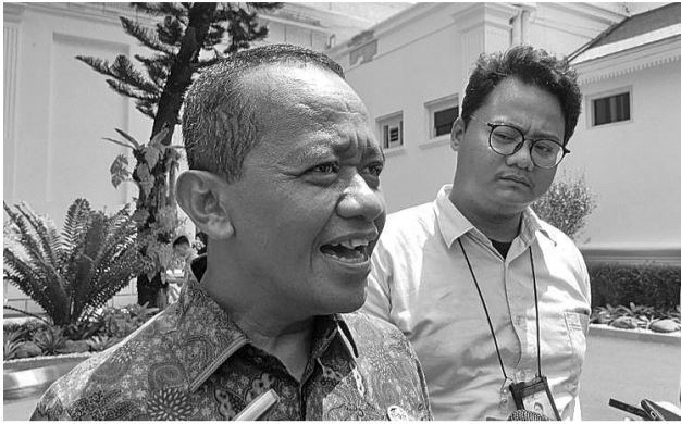
投资部长兼投资统筹机构主任巴赫利尔(左)

【本报讯】10月10日，投资部长兼投资统筹机构主任巴赫利尔表示，佐科维总统近期将访问中国和沙特阿拉伯。不过，访问时间还无法确认。早些时候，我与佐科维总统讨论了对中国和沙特阿拉伯的工作访问议程；其次，我报告了2023年第三季度的投资进展。