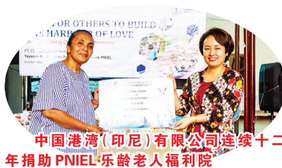
中国港湾(印尼)有限公司连续十二年捐助PNIEL乐龄老人福利院