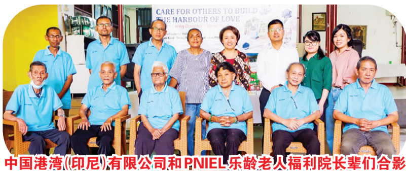
中国港湾(印尼)有限公司和PNIEL乐龄老人福利院长辈们合影