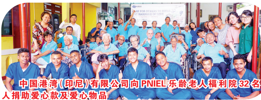
中国港湾(印尼)有限公司向PNIEL乐龄老人福利院32名老人捐助爱心款及爱心物品

【本报讯】爱心送温暖，百善孝为先。为弘扬“尊老、敬老、爱老、助老”的中华民族传统美德，传承“孝”文化，2023年10月10日，中国港湾(印尼)有限公司到南丹格朗PNIEL乐龄老人福利院(Yayasan Kasih Orang Tua dan Peduli Anak)开展了“关爱他人，筑就爱的港湾”主题捐助和慰问活动。