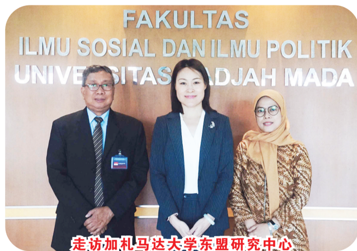
走访加札马达大学东盟研究中心

作，加快中国东盟自贸区3.0版谈判，高质量全面实施区域全面经济伙伴关系协定，进一步拓展数字经济、绿色经济、电子商务、智慧城市、人工智能等领域合作。三是持续扩大人文交流。以2024