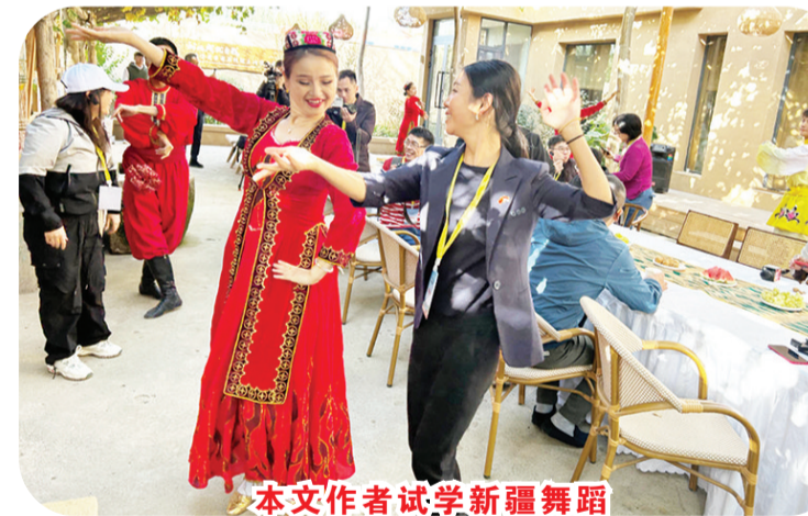
本文作者试学新疆舞蹈