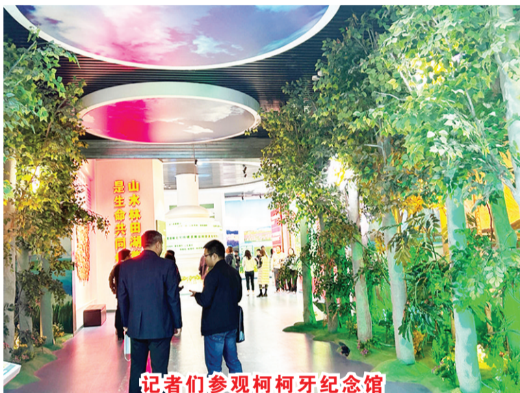
记者们参观柯柯牙纪念馆

达里夫等积极评价东盟中国关系取得的进展，介绍了东盟研究中心的主要成果，表示愿与中方继续加强交流合作，发挥自身在东盟研究等领域优势，助力东盟与中方深化交流互鉴，促进民心相通。