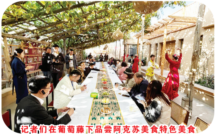
记者们在葡萄藤下品尝阿克苏美食特色美食