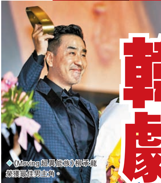
《Moving 超異能族》柳承龍榮獲最佳男主角。

香港文匯報訊（實習記者 趙雨竹）第28屆釜山影展已於10月4日正式開始。各影視作品與主創團隊也都期盼着拿到令人矚目的獎項。釜山亞洲內容大獎是亞洲地區最具影響力的獎項之一，每年吸引來自亞洲各國及地區的頂尖影視作品競爭。該獎項旨在表彰並鼓勵亞洲電視劇的優秀表現。大熱韓劇《MOVING 超異能族》連斬6獎，內地導演辛爽憑藉懸疑劇《漫長的季節》榮獲最佳導演。