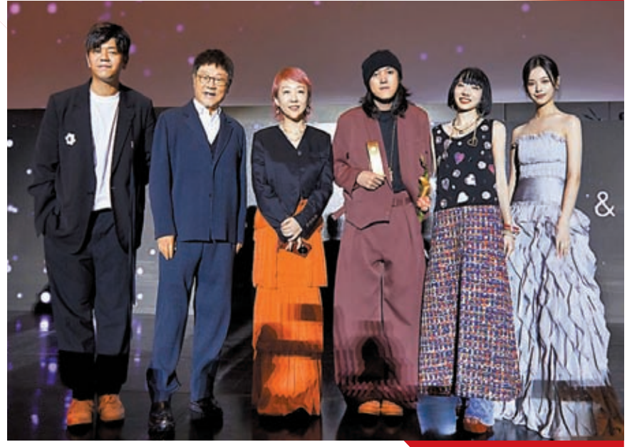
內地導演辛爽（右三）攜《漫長的季節》主創亮相釜山影展。

香港文匯報訊（實習記者 趙雨竹）第28屆釜山影展已於10月4日正式開始。各影視作品與主創團隊也都期盼着拿到令人矚目的獎項。釜山亞洲內容大獎是亞洲地區最具影響力的獎項之一，每年吸引來自亞洲各國及地區的頂尖影視作品競爭。該獎項旨在表彰並鼓勵亞洲電視劇的優秀表現。大熱韓劇《MOVING 超異能族》連斬6獎，內地導演辛爽憑藉懸疑劇《漫長的季節》榮獲最佳導演。