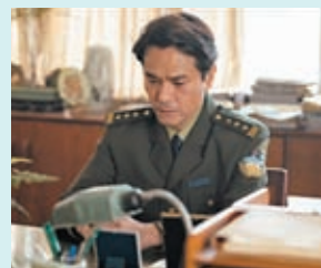
► 林家棟飾刑警，獲讚表現專業。