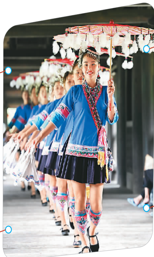
▲ 村民身穿侗族服装从风雨桥上经过。