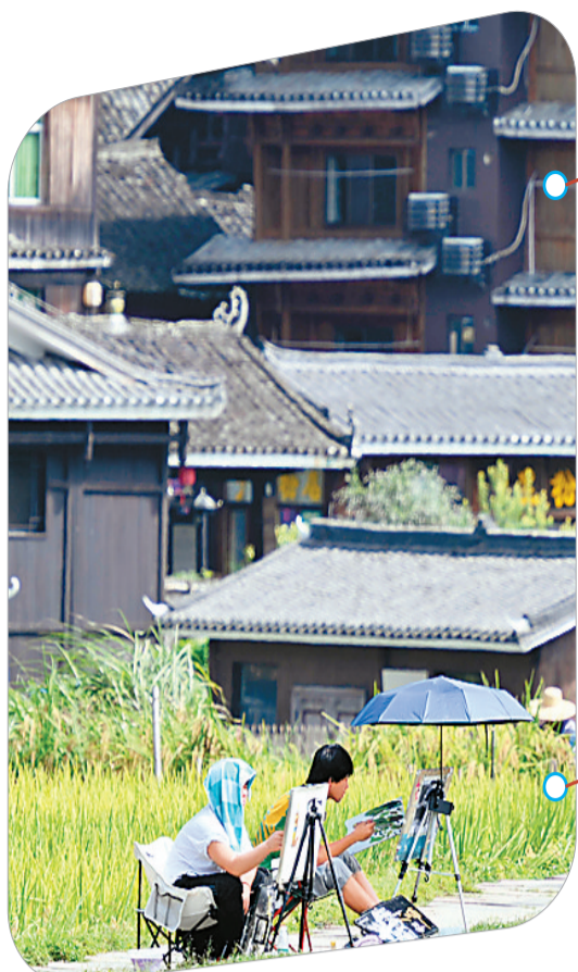
▲ 画家在程阳八寨写生。