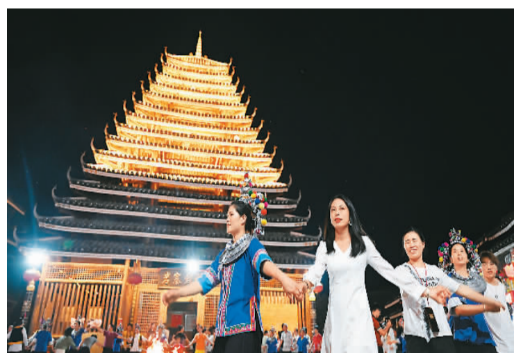
▲ 村民带领游客在鼓楼前跳起欢快的多耶舞。