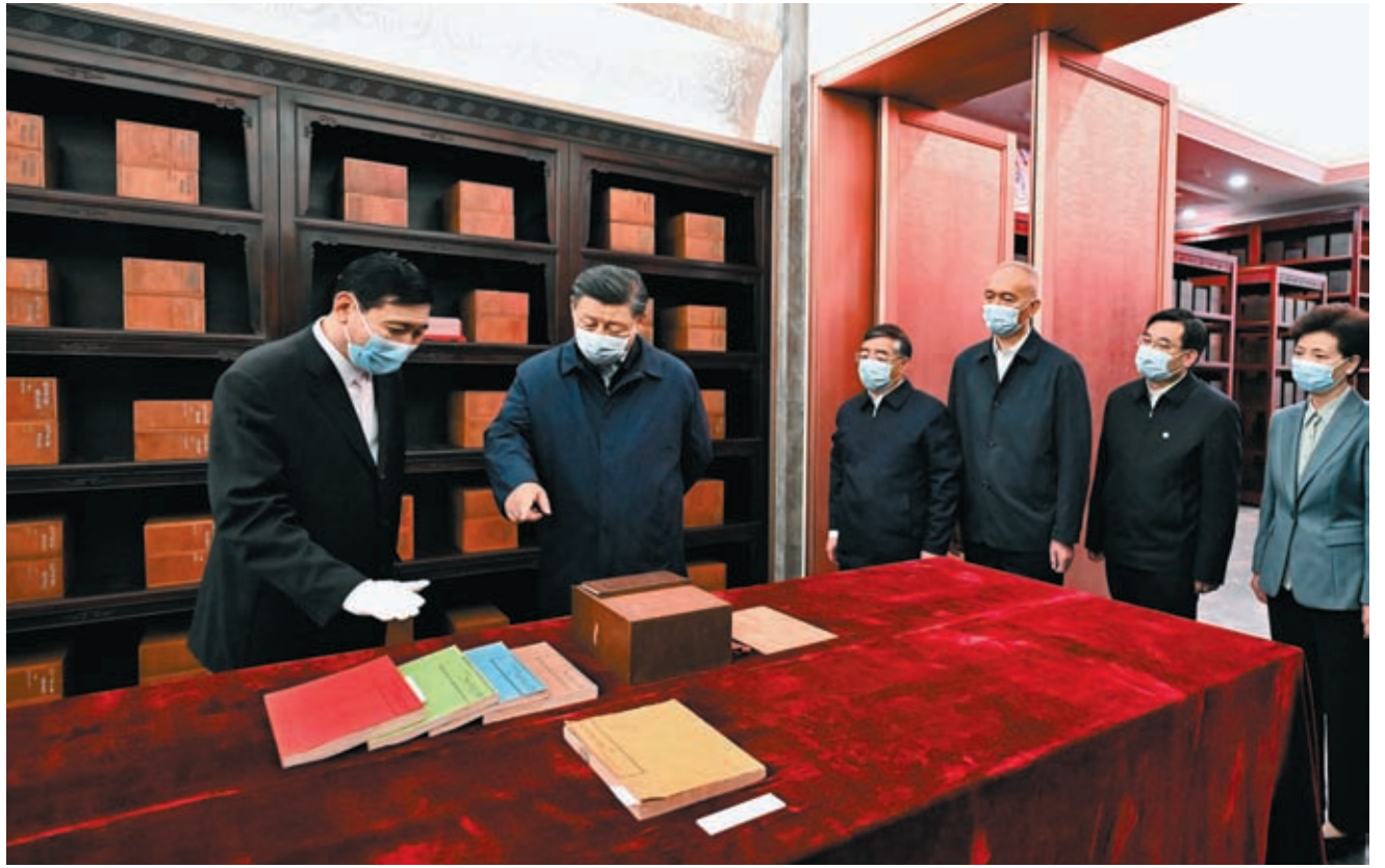
◆習近平強調，堅定文化自信，秉持開放包容，堅持守正創新。圖為今年6月1日習近平在中國國家版本館考察時，在蘭台洞庫了解館藏精品版本保存情況。

鬥的共同思想基礎，不斷提升國家文化軟實力和中華文化影響力，為全面建設社會主義現代化國家、全面推進中華民族偉大復興提供堅強思想保證、強大精神力量、有利文化條件。 習近平強調，各級黨委（黨組）要把做好宣傳思想文化工作作為重大政治責任扛在肩上，確保黨中央關於文化建設的決策部署落到實處。各級宣傳文化部門要強化政治擔當，勇於改革創新，敢於善於鬥爭，不斷開創新時代宣傳思想文化工作新局面。 全國宣傳思想文化工作會議10月7日至8日在京召開。會上傳達了習近平重要指示。中共中央政治局常委、中央書記處書記蔡奇出席會議並講話。 中共中央政治局委員、中央宣傳部部長李書磊作工作布置。 中央網信辦、人民日報社、中央廣播電視總台、國務院國資委、北京市委宣傳部、四川省委宣傳部負責同志作交流發言。