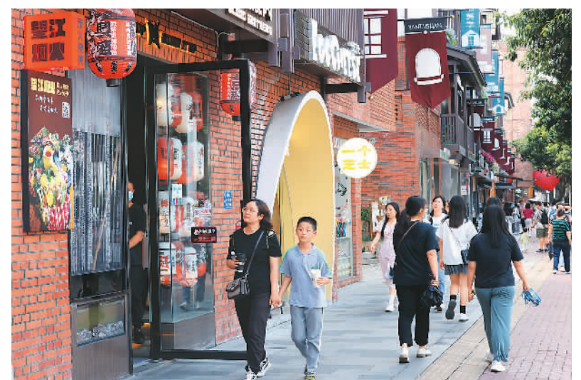
近年来，福建省福州市仓山区积极推动文旅融合，通过一系列优惠政策助力文旅产业高质量发展。图为近日游客在当地烟台山景区游玩、购物，感受当地文化特色。