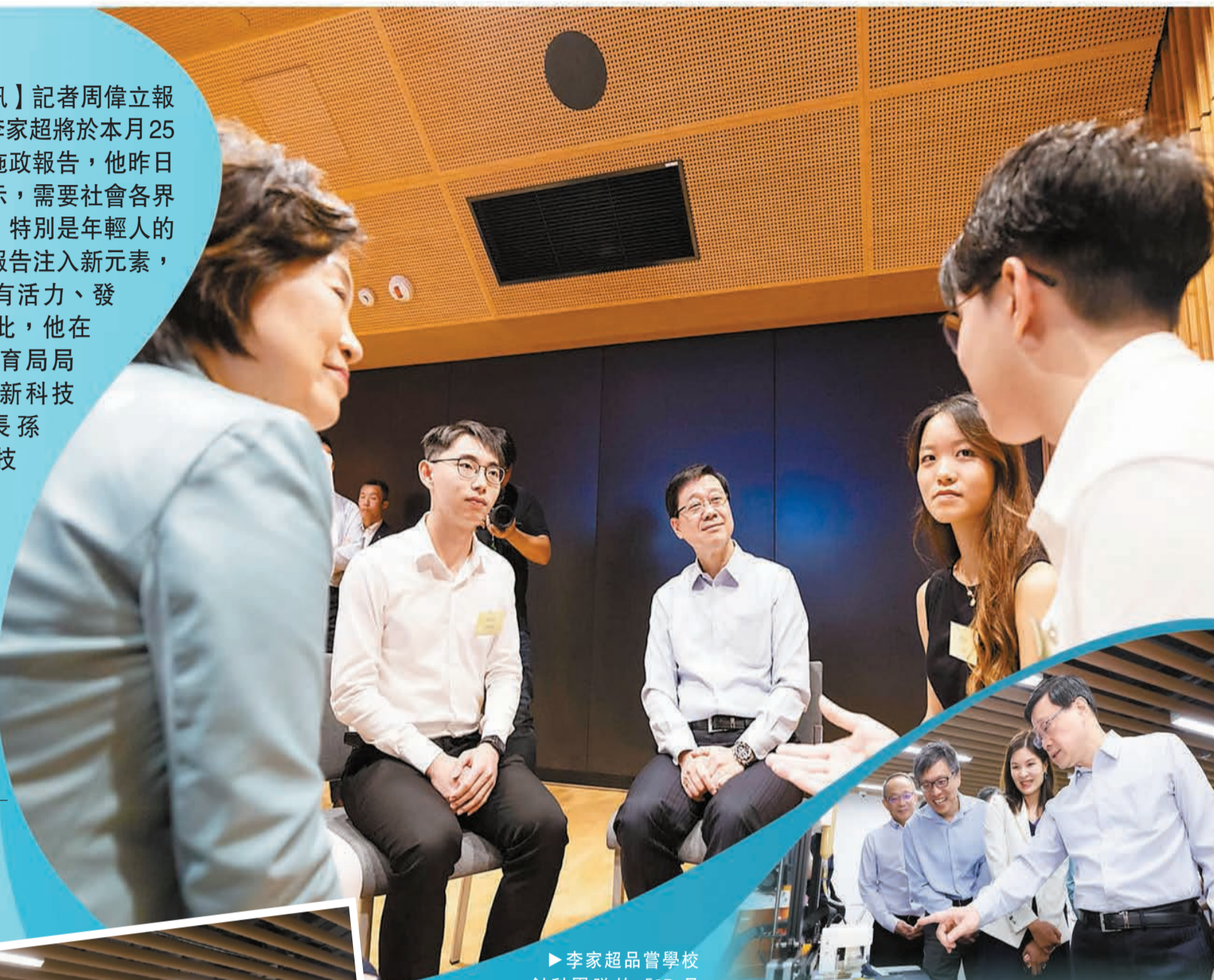
李家超品嘗學校創科團隊的「3D月餅」後大讚味道十分好。