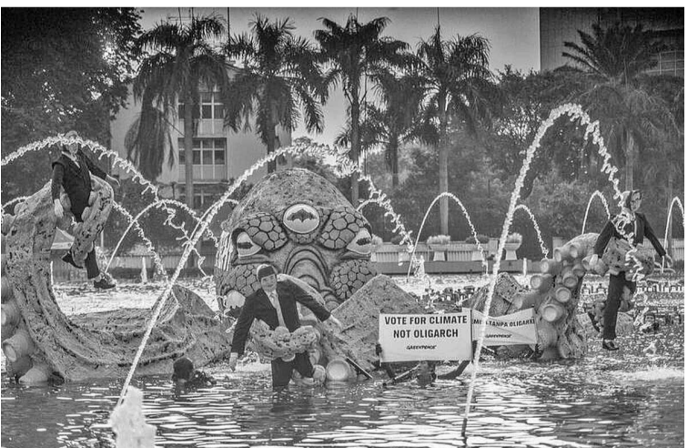
环保志愿者的和平抗议活动

【本报讯】全国绿色和平组织要求警方立即释放10月6日上午在雅加达中区印尼大旅馆环形交叉路口周围举行和平抗议的社会活动人士或环保志愿者。