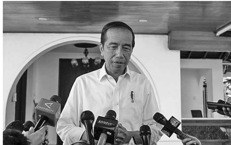
总统回应有关肃贪委领导勒索前农长雅辛案

【本报讯】佐科维总统对肃贪委领导层对前农业部长雅辛进行的勒索案件表态，他表示将这些