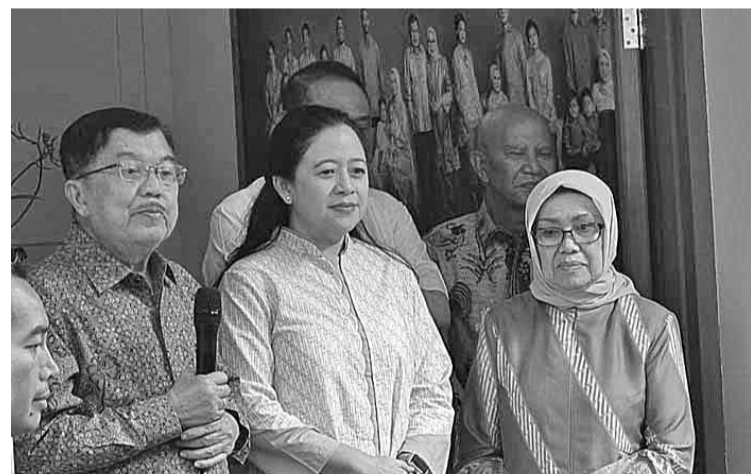
左起：卡拉会见普安

卡拉表示，目前所有的总统候选人都有相同的参选机会。不论是甘贾尔(Ganjar Pranowo)、普拉波沃