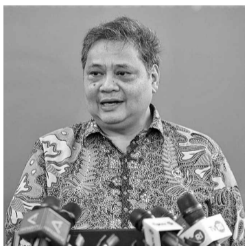
经济统筹部长艾朗卡

【本报讯】政府计划加强对“托购服务”活动(Jas-tip)的监控措施，并称，此项举措是为保护国内市场的策略之一。