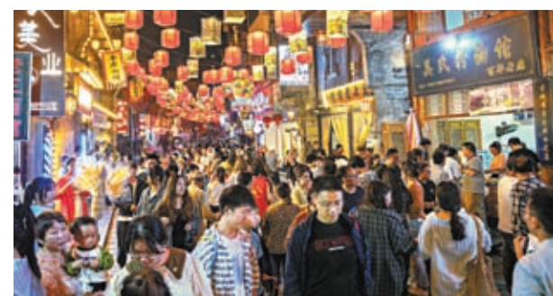
◆分析師正在密切關注國慶長假的數據，尋找消費者信心增強的跡象。資料圖片

恆生認為，內地當局正加強振興經濟的措施，從減息及降低銀行存款準備金率，到放寬購房限制及推行政策支持股市與提升投資者信心。考慮到政策從推行到見效需時，相信短期內的經濟挑戰仍然存在，稍後政策的效果才會彰顯，仍維持今年內地經濟增長預測為5.3%。