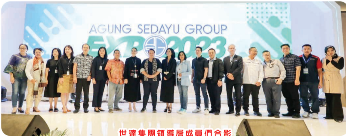
世達集團領導層成員們合影

Casa Pasadena 面向年轻家庭 and 千禧一代 - PIK2。此住宅拥有各种区域设施, 例如价值数百亿盾的房屋。配备占地 10 公顷的生态走廊, 该区域距离酒店仅 3 分钟路程 2 号收费站交汇处, 只需 30 分钟即可到达苏加诺哈达机场 (无需付费)。PIK2 本身是一座拥有世界一流设施的海滨城市一座拥有现代科技的综合性、智慧型、绿色城市房地产开发具有广阔的投资机会。#ASGEXPO2023 见!