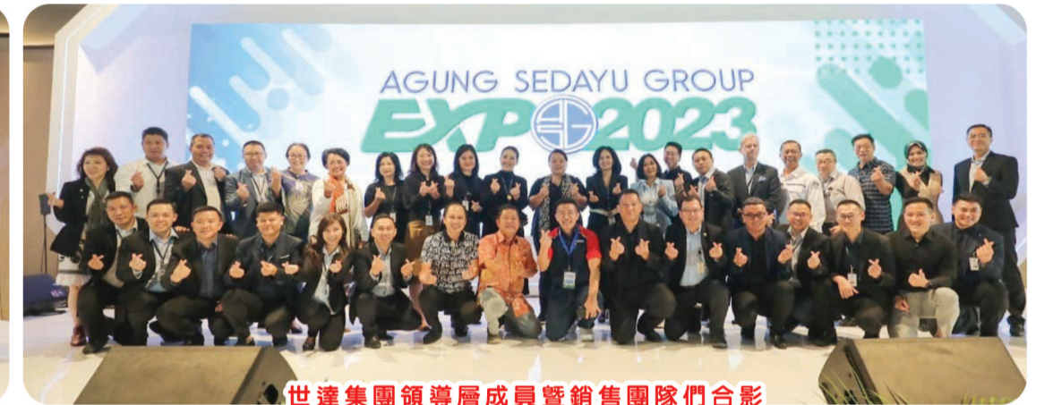
世達集團領導層成員暨銷售團隊們合影