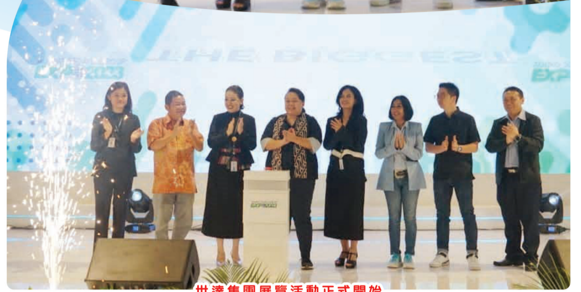
世達集團展覽活動正式開始

Casa Pasadena 面向年轻家庭 and 千禧一代 - PIK2。此住宅拥有各种区域设施, 例如价值数百亿盾的房屋。配备占地 10 公顷的生态走廊, 该区域距离酒店仅 3 分钟路程 2 号收费站交汇处, 只需 30 分钟即可到达苏加诺哈达机场 (无需付费)。PIK2 本身是一座拥有世界一流设施的海滨城市一座拥有现代科技的综合性、智慧型、绿色城市房地产开发具有广阔的投资机会。#ASGEXPO2023 见!