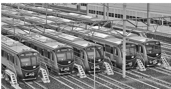
交通部计划在明年8月开始建设巴拉拉查-芝卡朗地铁线

【本报讯】交通部确保开工建设地铁东西线从巴拉拉查(Balaraja)到芝卡朗(Cikarang)的路线。