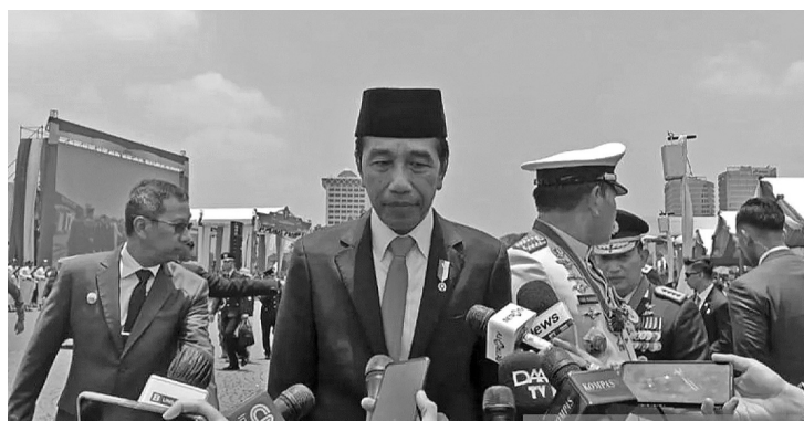
佐科维总统表示退休后无意担任斗争民主党总主席