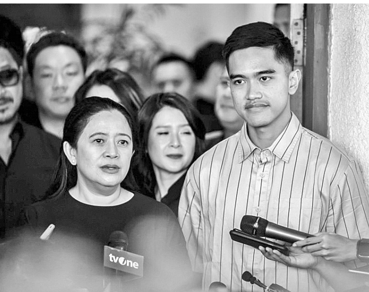
左起：普安与凯桑会谈

普安表示，在会晤中，印尼斗争民主党正希望刚由凯桑领导的印尼团结党与印尼斗争民主党都持开放态度。在这次会晤中，我们试图能够相互敞开心扉，讲述或传达凯桑在印尼团