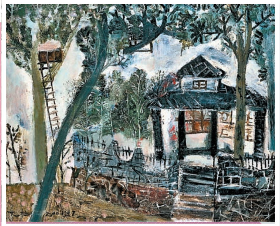
◆《我在杭州的家》，布面油畫，私人收藏，1947，65x80.7cm

現場觀賞趙無極的原作，可以深切感受到他的用筆用色，許江還記得在講習班的時候，趙無極喜歡用大刷子，當時還打算成立一個刷子畫派。「這次展示的作品中，可以看到趙無極的大刷子，一把刷子刷一種顏色，洗得乾乾淨淨，通過『塗抹提按擦』等諸多的隨心率的動作來實現某種植物一般肌理和線條的效果。趙無極將他對油畫油色的理解畫入了東方的渾茫氣象，並以纖維般的線條來書法中國山水的撇捺。趙先生是用油的大師，他的語言中不僅有東方的灑然之氣，還有油色氤氳揮灑的風雅，這份風雅中有狂倒，有輕浮，有放拓，有收斂，有光感的炸裂，有心靈的震盪，有激情詩性，有人性的最高級的精微之感。只有真正看原作，才真正了解他，才能與他有一種會心的東西。」