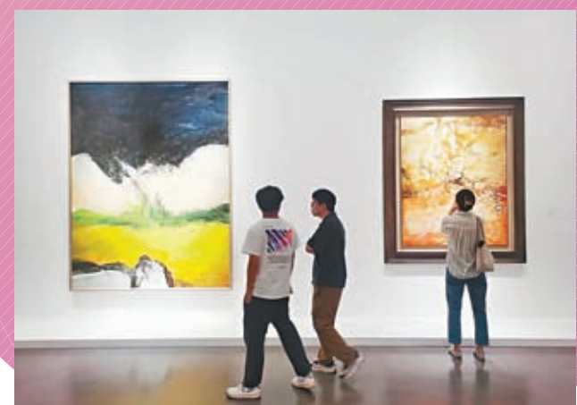
◆展覽吸引眾多觀眾入場觀看並拍照留念。