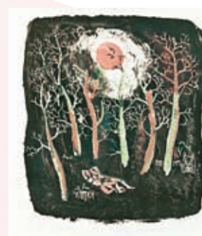
◆《亨利·米修解讀趙無極的八幅石版畫》，石版畫，私人收藏，1950，45x65cm