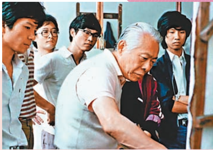
◆1985年趙無極繪畫講習班。