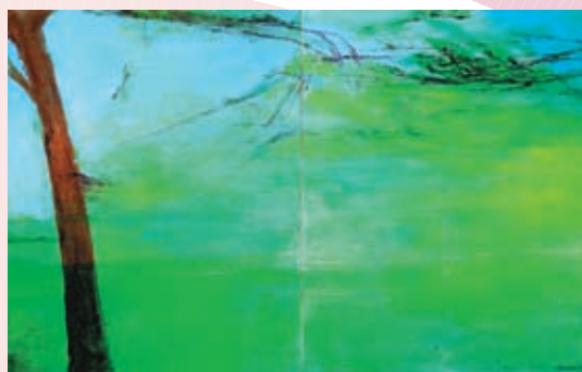
◆《向塞尚致敬 雙聯畫》，布面油畫，私人收藏，2005，162x260cm