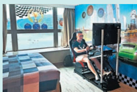
◆帝景酒店的電競主題房間

就像來到該區，不去深井吃一碟燒鵝一樣。香港本地朋友反饋，這裏是香港人還能吃到大排檔的地方。在「吃燒鵝去深井」的盛名之下，來訪者也好奇，應該去吃哪一家。本地朋友又笑笑說，別抱着打卡網紅餐廳的心態去吃，走進村裏，哪一家看着有眼緣，進去吃都不會出錯。此地，每一家開在街道上的老店，都有自家獨特的手法。燒鵝之外，藏匿在街市裏40多年歷史的懷舊港味冰室，豬扒和厚蛋超多汁。本地人都超愛的荃灣美食街，各式港式小吃：雞蛋仔、沙爹串串、港式特飲也都網羅一眾臨近廣東遊客的「老廣胃」。傳統糖水老店每日現磨，出行探索，總要有些平靚正的小驚喜來調味。帝景酒店主打悠閒寫意，主題客房卻全年