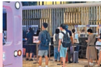
◆不少內地客讚譽它為「性價比之王」