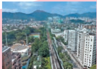
◆酒店「獅房菜」可享獅子山景觀