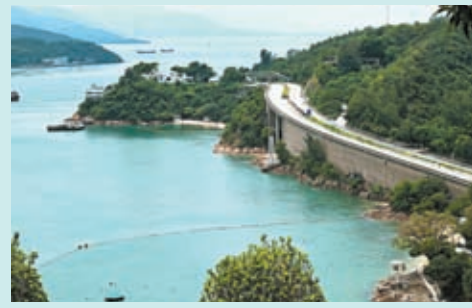
◆可以看海路橋風景的房間

齡段覆蓋。童年的樹屋、青年的電競屋，長租的商務房，相比過客匆匆的鬧市酒店，此地顯然希望發展出「快樂驛站」的情誼。酒店也十分坦誠，主打高性價比的房型，2張雙人床，可入住4人，家人、朋友一起前來，合適省錢、住得舒服。人均價格，據說來過的遊客紛紛感嘆「平靚正」。