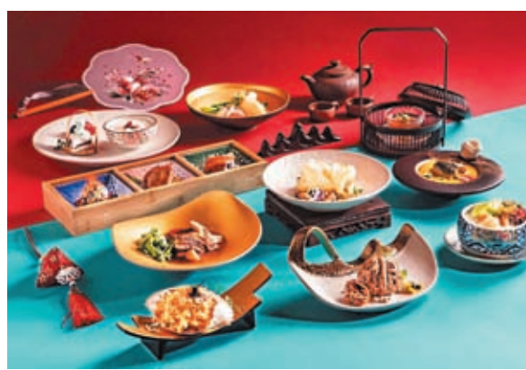
◆創新九道菜式「愛玲宴」