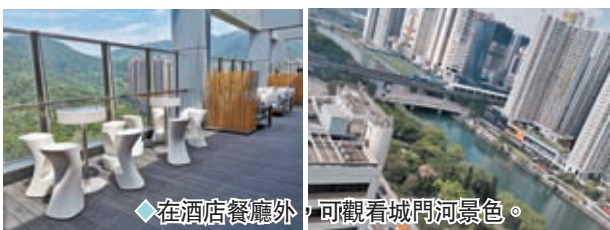
◆在酒店餐廳外，可觀看城門河景色。

如果酒店有性格，帝逸應該是一位善談有趣的陽光帥小伙。開放專門的樓層，也讓自己進入寵物友好型酒店的行列。帶著寵物住酒店，在內地許多一線城市，各城各地都有網友熱心總結的「十大寵物友好酒店」排行榜。如何照顧「寵物主子們」的度假需求呢？將心比心對待寵物朋友們。從準備的寵物所需零食、清潔用品，專屬餐具甚至專屬的浴袍，也讓不少入住者的心瞬間被「萌化」。三樓的寵物玩樂草坪，是每一個寵物到來後就盡情撒腿、奔跑探索的遊戲小部落。九、十月的天，風吹呀吹，白雲走得很快，一間舒服的酒店可以令你好好發懶一下。