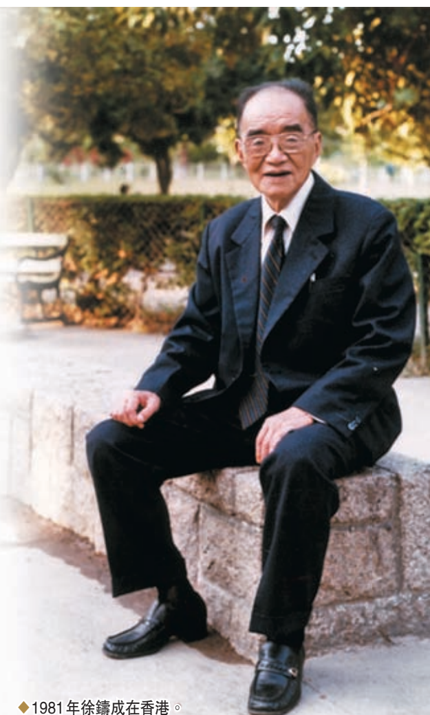
◆1981年徐鑄成在香港。香港文匯報北京傳真