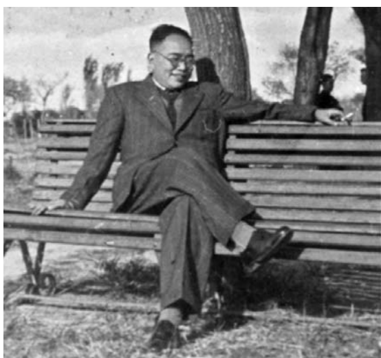
◆上世紀四十年代的徐鑄成。香港文匯報北京傳真

「祖父於1948年3月在上海開始籌辦香港《文匯報》，隨後兩次往返上海香港之間，廣泛商議並落實具體事項。9月香港《文匯報》創刊後，他擔任總主筆，全面負責言論工作。當時總經理沒有到任，他也兼管經理部工作。」徐時霖介紹。彼時，上海《文匯報》剛被國民政府關停，潘漢年和李濟深都支持徐鑄成到香港創辦報紙，徐鑄成回覆稱：「我要去辦，就辦《文匯報》，別的我不考慮。」在香港各界愛國人士的大力支持下，1948年9月9日，香港《文匯報》正式創刊。