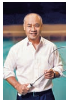
李寧創立自己品牌王國。

是有的，但對市場來說不會因為你有名就有好銷量，商品受到大家的認可最重要產品的技術和材料能夠滿足消費者的需求。至於我拍板將李寧前面上『中國』兩個字，因為在中國做一個品牌好艱難，中國人有很強的崇洋心態，阻礙了中國人開創自己的品牌。多年來，我希望品牌加上更多中國元素和文化，在2018年紐約的時裝騷，我將『中國李寧』的概念放到產品上，要大家知道我們從中國而來！原來這樣的表達令到好多中國人，特別是90後、00後的年輕人更為接受，他們也希望國家有自己的品牌和主張，外國消費者也很有趣。『中國李寧』4個漢字出自電腦，我們希望每一位懂得漢字的人一看便明白！」 1990年創立品牌，為什麼要用自己的名字？「產品要用『李寧』我是反對的，因為名字是父母給我的，但李經緯先生鼓勵用我的名字比用其他名字更好，這是他的市場理解！我並不相信有什麼好處，我更怕弄壞我的名聲，畢竟這是商品，我取得冠軍是全家之寶。現在用了33年，正如我想像一樣，李寧這個名字不再值錢，用錢