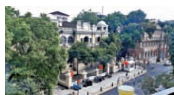
在廣州白天鵝賓館隔窗對望沙面的原德國領事館，飄揚着五星紅旗。

戶人家，變作尋常百姓家。沙面在宋元明清已是通商要津和遊玩勝地，可惜在鴉片戰爭中淪為英法租界，當時多個西方強雄霸一方，作為領事館專用區，規定華人不得內進。我終於明白為什麼當年霍英東先生寧願要運沙填海，幾經艱辛波折，也要選址沙面，建立我國中外合資的首個五星級酒店——白天鵝賓館。 沙面擁有的厚重歷史，是上一輩永遠磨滅不去的回憶——難怪母親每次都要入住白天鵝賓館，這裏有着她兒時說不盡的鄉愁與唏噓……今天，當看到紅旗飄揚，尋常百姓皆能走進沙面，要感謝新中國！正如白天鵝賓館送來其成立40周年的月餅和祝福：「無論天南地北，相聚與離別……祝生活像中秋的圓月，亮亮堂堂，圓圓滿滿。」也是我們每個中國人的願望！