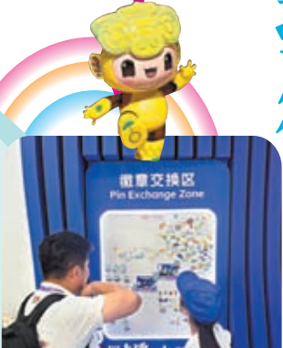
◆亞運村裏的徽章交換區成為了最新的社交場合。