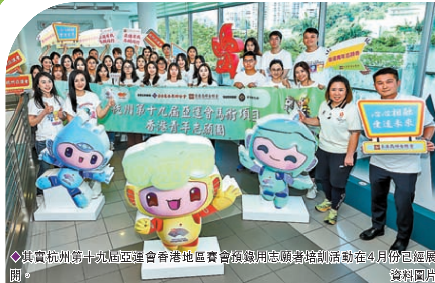
◆其實杭州第十九屆亞運會香港地區賽會預錄用志願者培訓活動在4月份已經展開。