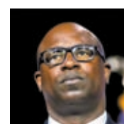
鮑曼(小圖)被指故意觸發火警警報。網上圖片