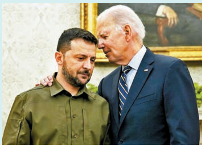
澤連斯基(左)上月訪美與拜登會面，希望說服美政界維持對烏支持。

美國從去年 2 月至今對烏合共批准約 1,130 億美元各類援助。《紐約時報》提醒，儘管兩黨多名國會議員均表示，他們有信心未來數周通過對烏援助法案，但短期支出法案凍結援烏資金，已經是美國對烏支持減弱的訊號，今次通過臨時解決方法後，兩黨圍繞政府支出尤其對烏援助的鬥爭，料很快會重新點燃。