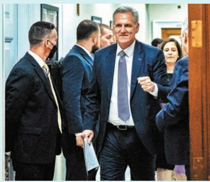
麥卡錫(前)握拳慶祝短期法案獲通過。