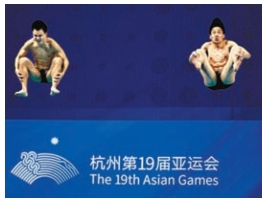
杭州第19屆亞運會 The 19th Asian Games

跳水項目接下來會再誕生兩面金牌，其中陳藝文會夥拍雅妮出戰女子雙人3米跳板；楊昊則夥拍傑傑出戰男子雙人10米跳台。