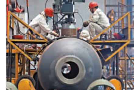
◆ 中國9月製造業PMI升至50.2%。圖為江蘇南通一企業，工人在工作中。資料圖片