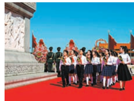
◆ 少年兒童獻上手中鮮花並瞻仰紀念碑。