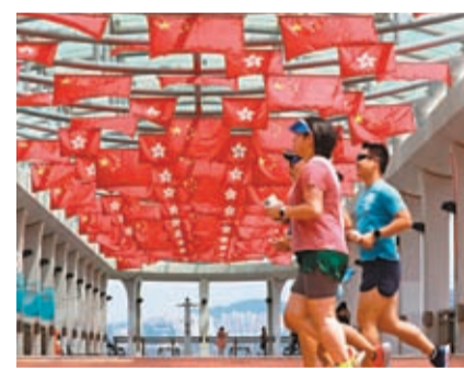
◆ 國慶期間，香港各區充滿喜慶氛圍。圖為中環碼頭旗海飄揚。

「2023年國慶煙花匯演」，逾千間食肆的指定菜式和餐飲提供折扣優惠，而交通工具亦作出了特別安排，讓市民深刻感受祖國母親生日的歡樂氣氛。