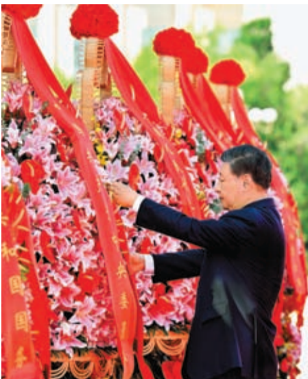
▲ 習近平整理花籃上的綵帶。新華社

9月30日上午，黨和國家領導人習近平、李強、趙樂際、王滙寧、蔡奇、丁薛祥、李希、韓正等來到北京天安門廣場，出席烈士紀念日向人民英雄敬獻花籃儀式。新華社