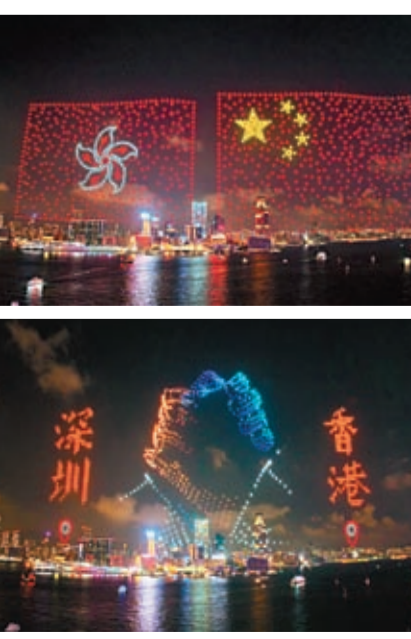
◆ 深港2,400架無人機首次雙城聯飛。圖為無人機組成國旗與區旗（上圖）以及香港與深圳雙手緊握造型（下圖）。

「月來越好，歡樂灣區」深港無人機聯飛表演由香港特區政府和中央政府駐港聯絡辦指導，紫荊文化集團主辦，中國人壽保險（海外）股份有限公司全力支持。