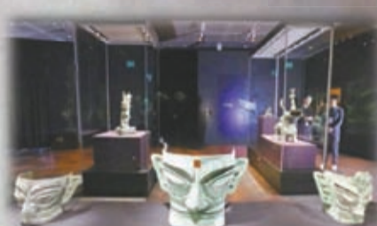
展覽共展出120件珍貴文物。

展覽廳設有十多個多媒體裝置，如採用虛擬修復技術，重建因結構安全問題，目前文物實體無法完成接駁拼合修復或原推斷為一體的數件文物。此外，展覽亦採用了沉浸式多媒體科技，展示三星堆博物館其中一件鎮館之寶「一號青銅神樹」，以3D全像投影1比1重現神樹的場景。三星堆人用銅、金、玉石表達對世界的理解和崇拜，青銅神樹是他們詮釋宇宙及神明力量的體現，在當時的社會和祭祀儀式中有重要地位，三星堆目前已發現六棵神樹，多媒體科技展示復原完成的一號青銅神樹，有三層九枝，上有立鳥、花朵、果實、帶翅懸龍、鈴鐺乃至金箔等，相當雄偉。配合同場展示的文物——二號神樹底座，從座上其中一個保存相對完好的小人像可見，曾握有禮器，樹枝上的環鈕推測用於懸掛飾物及銅鈴等。觀眾藉此可深入了解三星堆人的神秘宗教系統，並感受他們對神祇的虔敬之心。