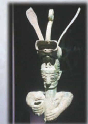
獸首冠人像。約公元前1300至公元前1100年，青銅。高40.2，長23.3，寬20厘米，1986年出土。

另一件珍貴文物是金光閃閃的面罩，該展品是三星堆出土約10件金面罩中保存得最好、最完整，也是最大的一件，重約350克，黃金佔比85%，還有銀和少量銅、鐵、錫等成分。邊緣向內捲，應附着在其他材質的人面形器上，但目前尚未發現完全對應的面具。