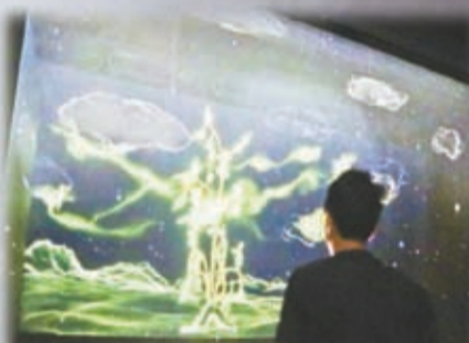
展覽以3D全像投影復原一號青銅神樹。