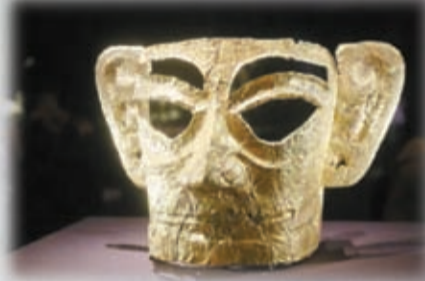
面罩。約公元前1300至公元前1100年，金。高17.5，寬31，深16厘米，2021年出土。