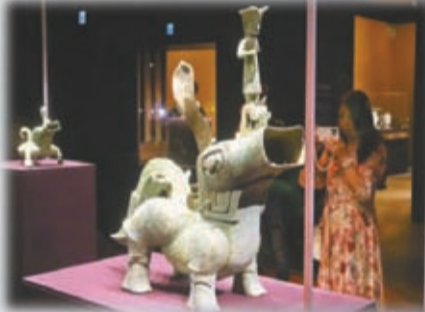
大神獸。約公元前1300至公元前1100年，青銅。高98，長104，寬39厘米，2022年出土。