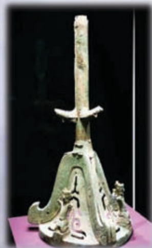
二號神樹底座。約公元前1300至公元前1100年，青銅。高94，底座直徑54.8厘米，1986年出土。