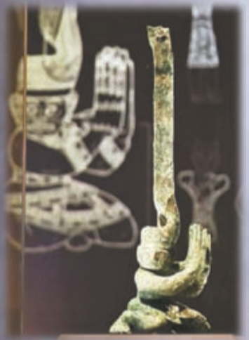
扭頭跪坐人像。約公元前1300至公元前1100年，青銅。高48，寬15.5，深13.6厘米，2021年出土。

展覽分為「穿越之眼」、「三星堆的城市生活」、「三星堆的神與巫」、「三星堆的來龍去脈」共四個單元。最引人注目為第一單元中的青銅大面具，香港故宮文化博物館助理研究員王聖雨對記者表示，該展品是三星堆乃至世界目前發現體積最大的青銅面具，重約65.5公斤。「面具出土時右眼處有絲綢物料殘留，發現有墨迹，推測當時已有文字。」她表示，面具的臉、眼、耳等各部位為分開鑄造，再鑄接成形。面具體體線條流暢，予人肅穆威嚴感。王聖雨續指，展覽以「凝視」命名也別具意義，因三星堆出土人頭像的其中一個特點，是雙眼比例異常大，眼睛炯炯有神，令人們有種被「凝視」的感覺。參觀者站在人頭像之前，就像突破了時空限制，互相「凝視」對方。