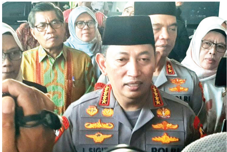
总警长里斯提约将军。