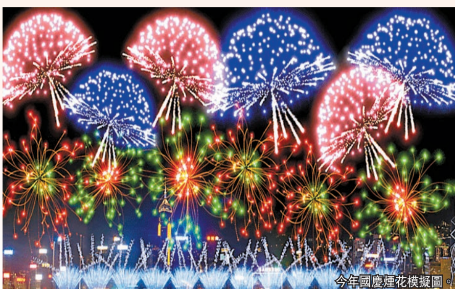
今年國慶煙花模擬圖。