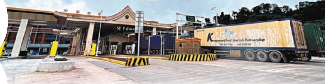
◆磨憨口岸2022年啟用中老貨運專用通道。