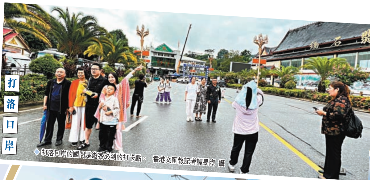
◆打洛口岸的國門是遊客必到的打卡點。