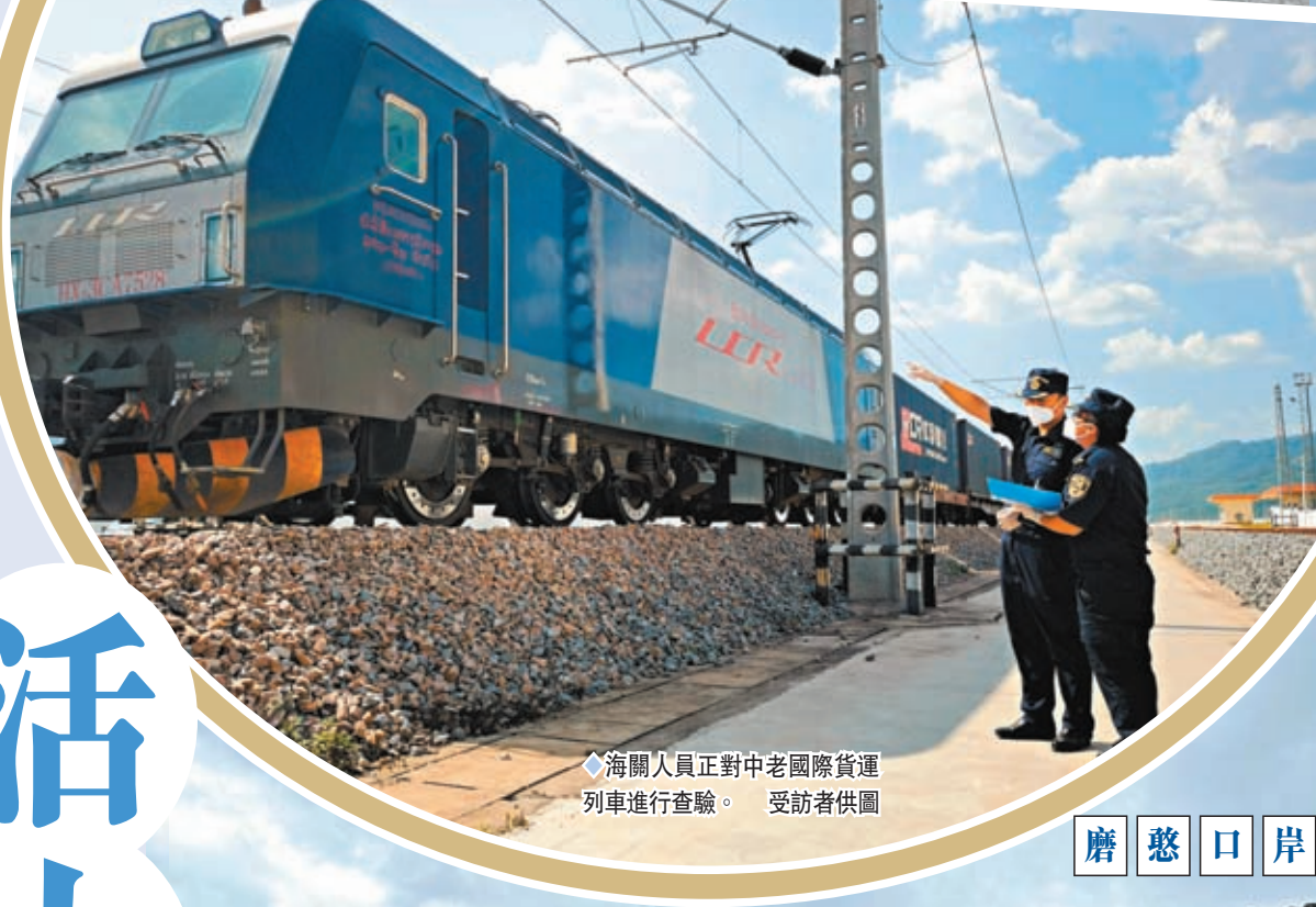
◆海關人員正對中老國際貨運列車進行查驗。