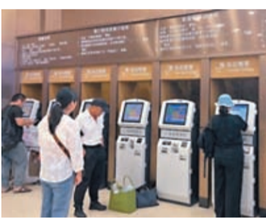
◆鐵路部門開始發售10月5日的火車票。網上圖片

截至9月24日晚，僅有9月30日當天極少數車次的商務座、一等座尚有餘票，而10月1日北京西站前往鄭州方向的夜間高鐵路有少部分餘票可供旅客選擇，不過當日其他時間段內的車次餘票仍十分緊張。