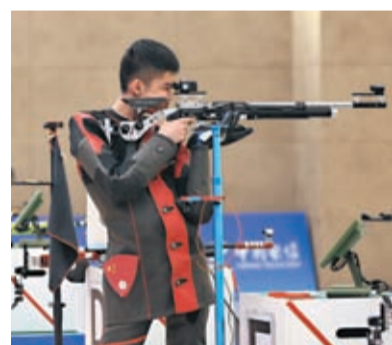
◆男子10米氣步槍：盛李豪破世界紀錄奪冠。