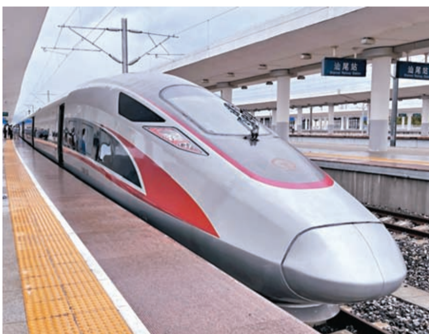
◆廣汕高鐵路26日正式開通運行。