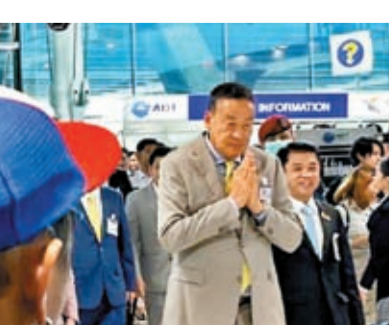
◆泰國總理賽塔潘（中），在機場迎接首批免簽中國遊客。

香港文匯報訊 據央視新聞報道，泰國總理賽塔潘多位內閣部長25日前往素萬那普國際機場，迎接免簽政策實施首日的第一批赴泰中國遊客。該批中國遊客乘坐泰國亞洲航空航班從