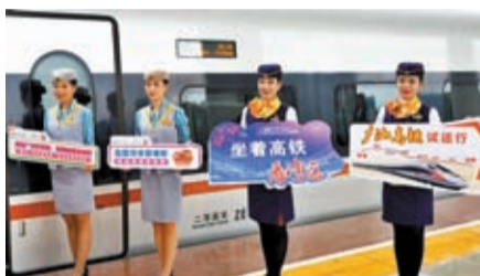
◆廣汕高鐵路試運列車從新塘站發出。

將組成新的更高標準的寧波至廣州高鐵路通道，是「八縱八橫」高速鐵路網沿海通道的重要组成部分。它的開通運營，為粵東革命老區增添了一條快速客運通道，極大便利沿線群眾出行，對助力老區加快融入粵港澳大灣區建設，促進區域經濟社會協調發展，具有十分重要的意義。