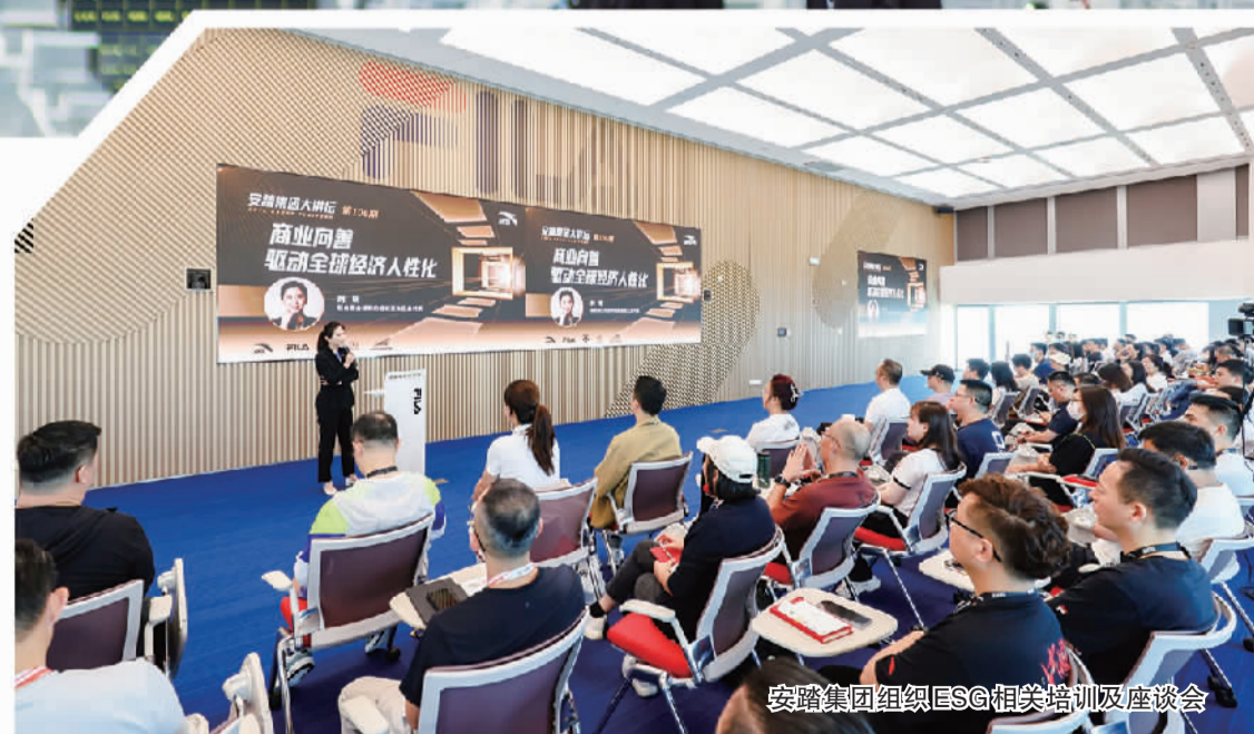
安踏集团组织ESG相关培训及座谈会