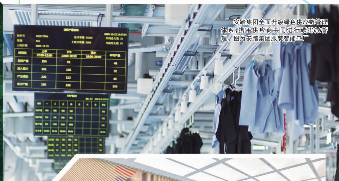
安踏集团全面升级绿色供应链管理体系,携手供应商共同进行碳排放管理。图为安踏集团服装智能工厂

可持续产品的比例提高到50% 50%的产品使用可持续包装 自有运输设备能耗的50%采用清洁能源替代 战略合作伙伴能耗的50%采用可再生能源替代 产品中使用50%可持续原材料