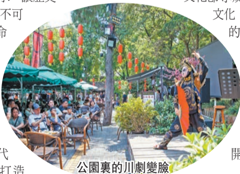
公園裏的川劇變臉

除了博物館和紀念館，還和多處開放的古城、街坊遺址也讓人們找到了歸屬感。拿位於成都老城的核心區域的東華門遺址來說，這裏不僅是2300年前城市的中心，更是城市歷史文脈的延續。完成對歷史記憶的儲