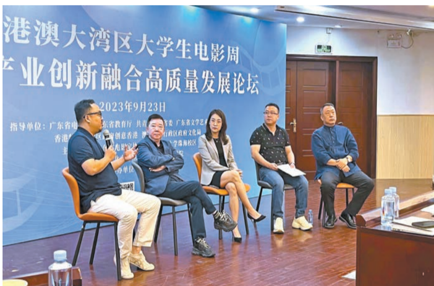
香港著名導演文雋（左二）參加主題為「灣區電影產業發展的戰略與定位」的分論壇。

中國電影評論學會常務副會長、研究員張衛表示，香港電影始終有着全球性的傳統，市場不應局限在自己的區域範圍