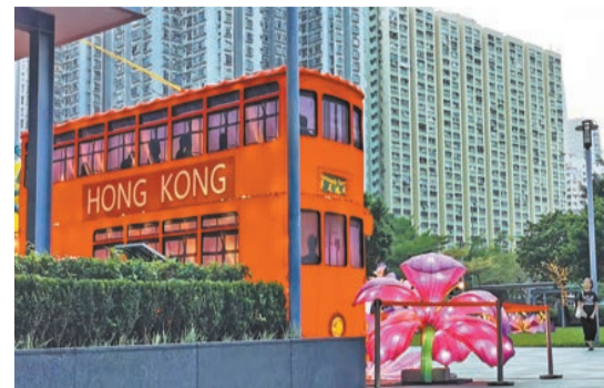
極具香港特色的叮叮電車燈組。

【香港商報訊】記者羅婧今報導：為促進四川省與香港的文化交流，由四川省港澳辦、四川省政府新聞辦、四川省文化和旅游廳主辦的「川燈耀香江」——2023中秋國慶燈會於9月24日至10月25日在香港東區愛秩序灣公園舉行，燈會面向香港同胞和在港遊客免費開放。9月24日晚8時，「川燈耀香江」——2023中秋國慶燈會將舉行啓動儀式。