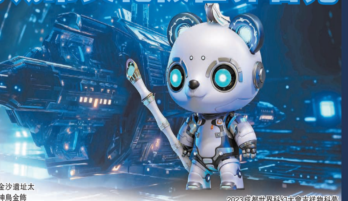
2023成都世界科幻大會吉祥物科夢

存後，成都還讓流動的生活美學在人們安穩、巴適的日常裏扎根。從知名度甚高的國際詩歌周、非遺文化節等城市文化品牌活動，鶴鳴茶社折射的品茗文化，到李白登高的散花樓、杜甫草堂對薪火的廣續，過去這些年，數不清的古典符號和印跡開始湧向前沿，為市民構築起學習和交流的平台。