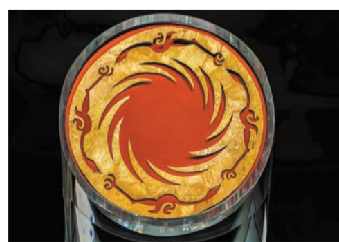
金沙遺址太陽神鳥金飾

今年2月，《成都市大遺址保護條例》正式實施，通過制度化剛性約束更好延續天府文化的根脈記憶。同時，深入發掘古蜀文化、三國遺蹟、南絲綢古道等古遺址，提檔升級金沙遺址博物館、武侯祠、杜甫草堂、