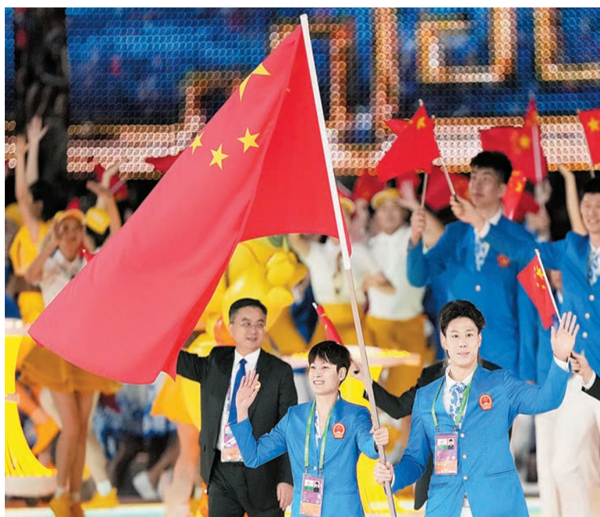
中國代表團在開幕式上入場。