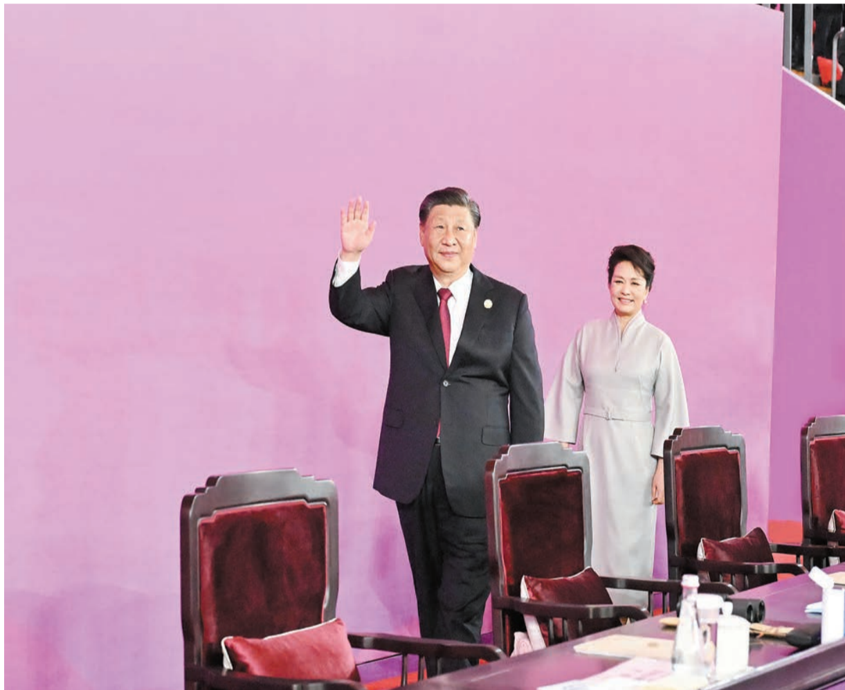
國家主席習近平在主席台上向大家揮手致意。新華社

中國代表團共有886名運動員參加本屆亞運會，其中有36名奧運冠軍，630位亞運新人。這些選手將參加除卡巴迪、板球以外的38個大項、407個小項的角逐。