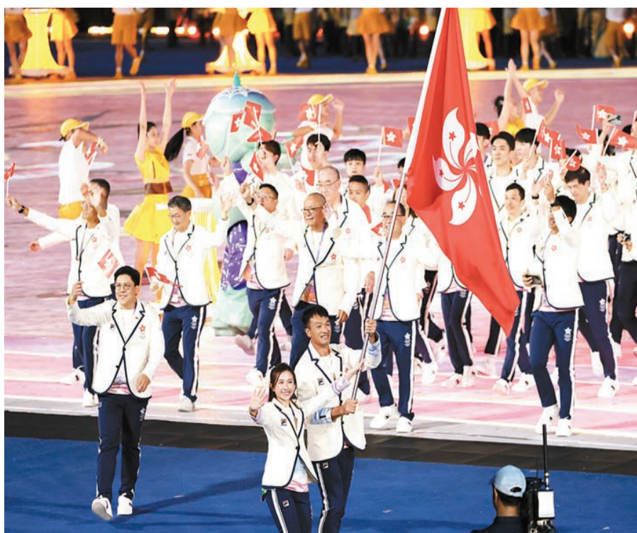
中國香港代表團團長、港協暨奧委會主席霍啟剛帶領中國香港代表團入場。

此外，康文署昨日在九龍公園體育館副場舉行「杭州第19屆亞運會——亞運直播區啟動禮」，在18區36個指定體育館的「亞運直播區」已於典禮後隨即開放，歡迎市民親臨觀賞亞運會賽事，支持香港代表隊全力以赴，再創佳績。