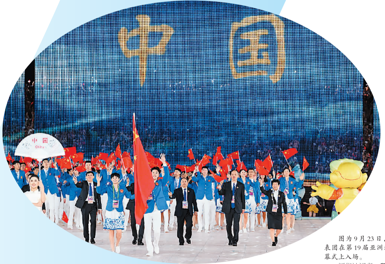
图为9月23日，中国代表团在第19届亚洲运动会开幕式上入场。