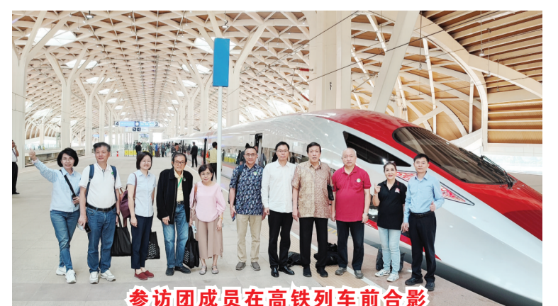
参访团成员在高铁列车前合影