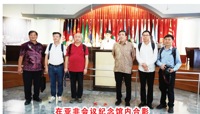
在亚非会议纪念馆内合影