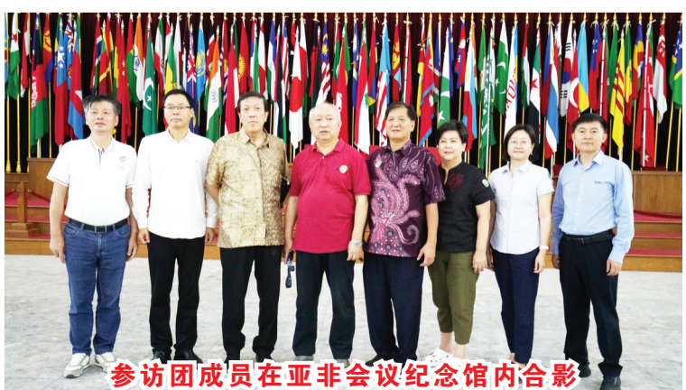
参访团成员在亚非会议纪念馆内合影