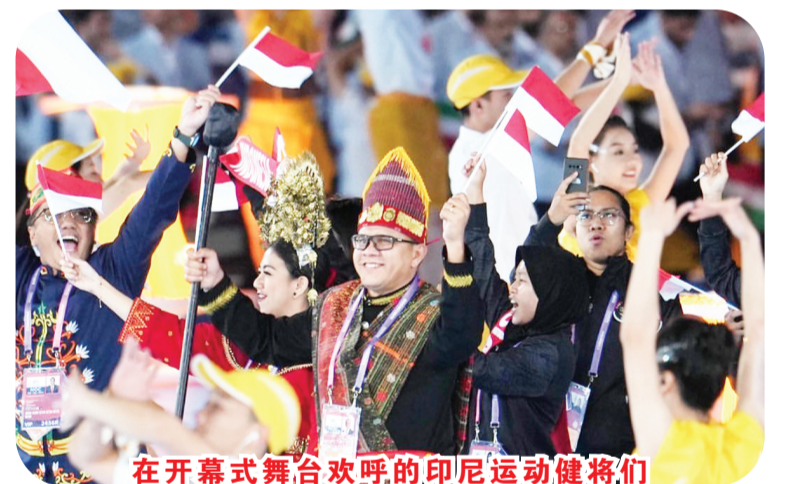
在开幕式舞台欢呼的印尼运动健儿们