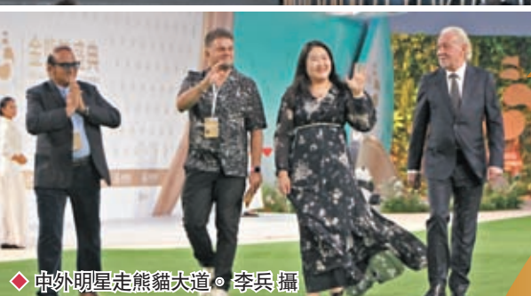
◆首屆金熊貓獎評選活動評委會主席張藝謀出席金熊貓盛典。