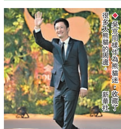
◆吳京同樣作為熊貓迷，收藏了很多大熊貓的周邊。

香港文匯報訊（記者李兵 成都報導）9月20日晚，成都「西博城」流光溢彩，群星璀璨。張藝謀、成龍、吳京、張頌文，以及本傑明·伊洛（法國）、鮑勃·安德伍德（美國）、尚塔爾·里卡茲（英國）、唐季禮（中國香港）等中外影視明星、導演等步入綠色的「熊貓大道」，首屆「金熊貓盛典」正式開啓。名導張藝謀任評委會主席，國際影星成龍則攜熊貓玩偶「龍龍」和「鳳凰」亮相盛典。