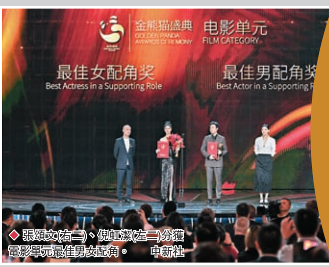
◆張頌文(右二)、倪虹潔(左二)分獲電影單元最佳男女配角。

香港文匯報訊（記者李兵 成都報導）9月20日晚，成都「西博城」流光溢彩，群星璀璨。張藝謀、成龍、吳京、張頌文，以及本傑明·伊洛（法國）、鮑勃·安德伍德（美國）、尚塔爾·里卡茲（英國）、唐季禮（中國香港）等中外影視明星、導演等步入綠色的「熊貓大道」，首屆「金熊貓盛典」正式開啓。名導張藝謀任評委會主席，國際影星成龍則攜熊貓玩偶「龍龍」和「鳳凰」亮相盛典。