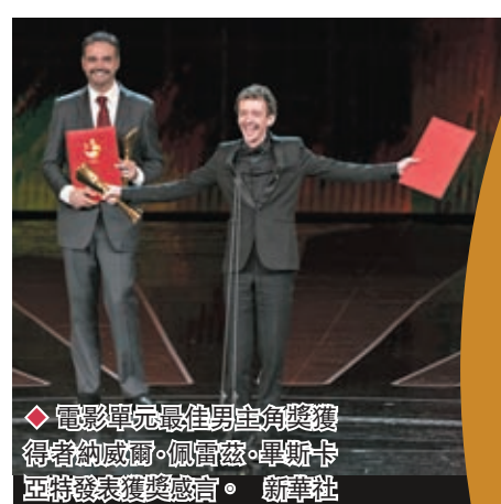
◆電影單元最佳男主角獎獲得者納威爾·佩雷茲·畢斯卡亞特發表獲獎感言。 新華社

聯合國前副秘書長埃里克·索爾海姆以《文明互鑒與人類命運共同體》為題作主題發言，一開始便帶領聽眾「穿越」回到公元13世紀。當時，年輕的意大利旅行家馬可·波羅遠赴中國，對所見所聞感到驚嘆不已。然而，他回到歐洲後，卻沒有人相信關於中國的故事，稱他為「百萬先生」，認為他誇張了一百萬倍。「在幾乎整個人類歷史上，中國一直擁有廣袤的疆域、先進的技術和燦爛的文化。」埃里克·索爾海姆表示，不同的文明之間應該積極展開建立在一定基礎之上的對話，在尊重和對話的基礎上進行學習、借鑒。