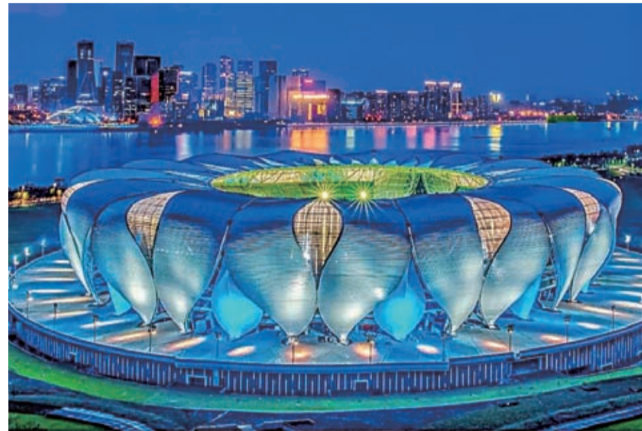
亞運會開幕式將在「大蓮花」主場館舉行。

不同藝術形態的融合 通過「宋韻嫁接芭雷」、「音樂劇串聯越劇」等形式，體現中國與亞洲各國文化互鑒。