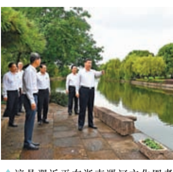
這是習近平在浙東運河文化園考察。