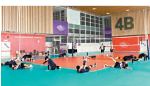
運動員在杭州奧體中心綜合訓練展開訓練。

香港文匯報訊 綜合報道：杭州亞運會今天開幕，已抵達參賽地的各國代表團運動員們積極備賽，認真開展賽前訓練，期待在杭州亞運會上勇創佳績。在杭州賽區，已經抵達的各國運動員們在各個場館展開適應性訓練。舉行乒乓球項目比賽的杭州拱墅運河體育公園體育館，場館劃出的9塊訓練場地每天都排滿了訓練。在湖州德清體育中心體育館，泰國、中國香港等國家和地區的運動員從18日起就開始進行備賽訓練。新加坡等國的運動員在千島湖的青山綠水間展開訓練，享受美麗的自然風光，期待在這裏取得好成績。富陽水上運動中心是賽艇和皮划艇項目的比賽場地。中國、科威特、烏茲別克斯坦等多個國家代表團的男女子參賽選手都集中在這裏進行賽前訓練。運行團隊全體人員也都到崗到位，全力做好服務工作。今次亞運會將有來自45個國家和地區約1.25萬名選手參賽。各國代表團和選手認為，中國