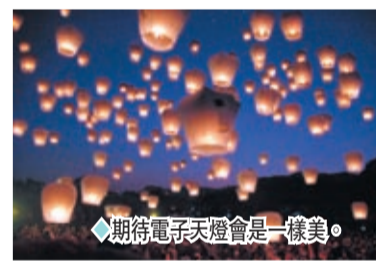
期待電子天燈會是一樣美。

最為有代表性的是，開幕式會將杭州地標古建拱宸橋以裸眼3D效果搬上舞台，這個橫跨京杭大運河的石橋將在開幕式上成為一個連接古今的媒介。表演方面，雙3D威亞也將雙人舞搬到了空中，舞者屆時會與地屏和網幕上呈現的超高比例還原的錢塘江交又潮、一線潮等反覆互動。此外還有數字穹頂，放大的籃球、足球，讓觀眾可以看到最為震撼的場景。