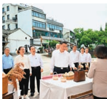
這是習近平在李祖村考察。

20日下午，習近平總書記在紹興市考察。他來到楓橋經驗陳列館，重溫「楓橋經驗」誕生演進歷程，了解新時代「楓橋經驗」創新發展情況，並前往浙東運河文化園，了解古運河發展演變歷史和大運河保護及大運河國家文化公園建設等情況。