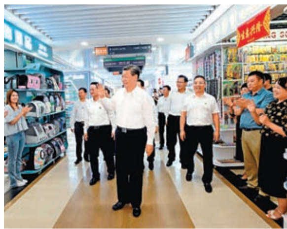
這是習近平在義烏國際商貿城考察。