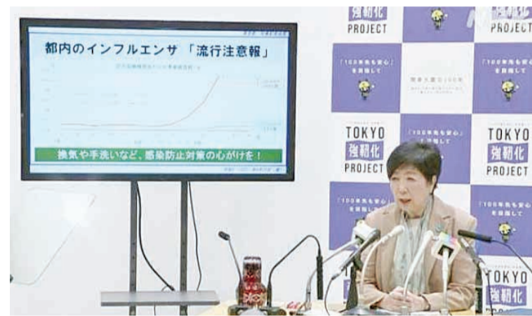
日本東京都知事小池百合子22日表示，東京可能在4周內出現流感大流行。

此外，針對當地的新冠疫情，小池表示，雖然情況正持續向好，但10多歲的感染者仍在增加，呼吁民眾勤通風勤洗手，不要掉以輕心，做好自身防疫。