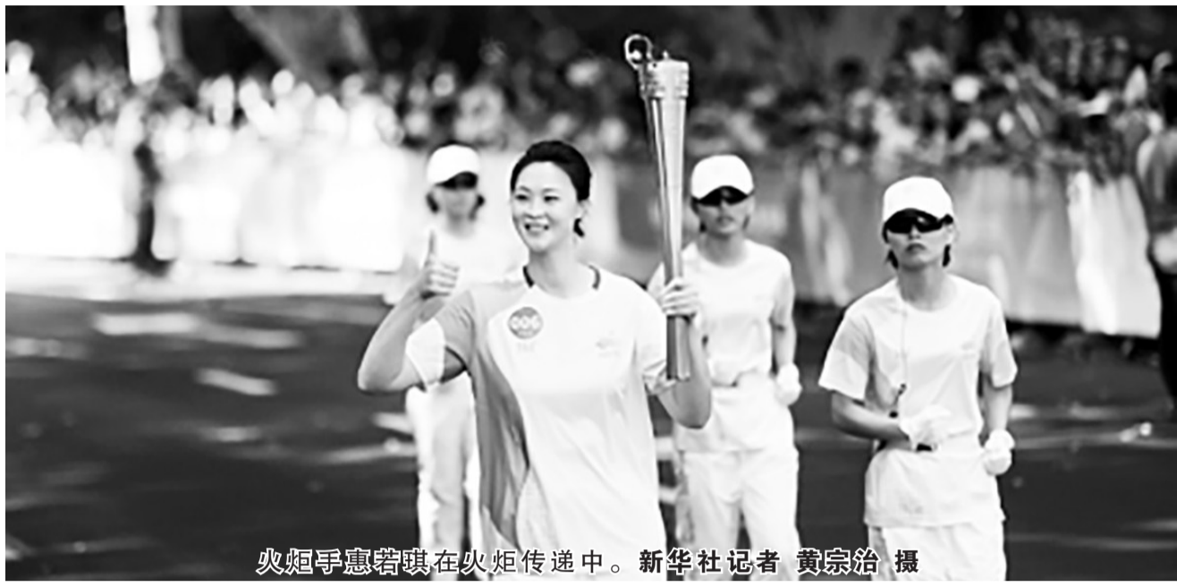
火炬手惠若琪在火炬传递中。