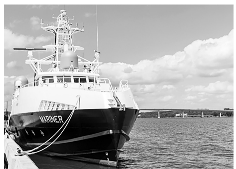
刚刚抵达日本的“水手”号与“游骑兵”号无人水面舰艇

【环球网报道】据俄罗斯卫星通讯社报道，美国已经将无人舰艇派往日本，以提升美国在(亚太)地区的战备程度。报道称，美军数艘原型无人舰艇于周四抵达日本东京附近的一个港口，参加一场“旨在测试战争和侦察能力”的海上演习，报道称，此举表明美国对中国不断增长的海军舰队感到“担忧”。