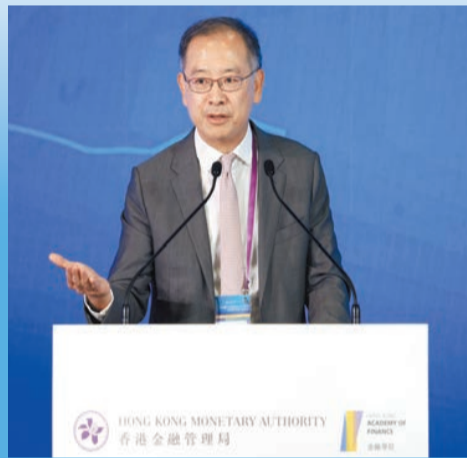
余偉文表示，自今年第二季以來，看到宏觀環境有所改善，供應鏈中斷有所緩解，通脹壓力也有所緩和。 資料圖片

【香港商報訊】金管局總裁余偉文昨在中投論壇上以英語發表演講，提及去年對投資者來說是最具挑戰性的一年，由於全球通脹飆升至幾年來的最高水平，各國央行紛紛加息遏制通脹，去年成為近半世紀以來，股票、債券和外幣兌美元匯率均錄得負收益的唯一一年。因此，包括金管局在內的80%儲備管理人去年都蒙受虧損。