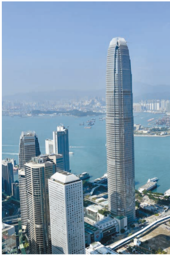
亞行將香港今年的經濟增長預測，由4月時的3.6%，提高0.7個百分點至4.3%。 資料圖片

報告稱，該行預期亞太地區發展中經濟體今年將增長4.7%，較此前預測的4.8%略有下調。另外，該行維持區內明年4.8%的增長預測不變。報告又稱，該行預料亞太地區發展中經濟體今年的通脹率為3.6%，低於該行今年4月提出的4.2%預測值，主因