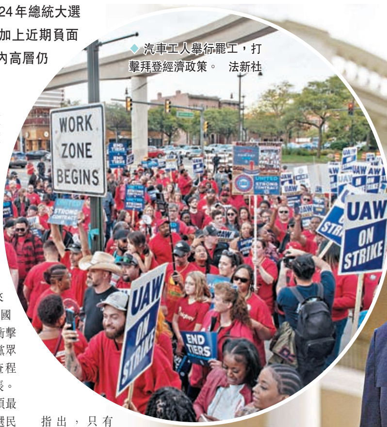
◆汽車工人舉行罷工，打擊拜登經濟政策。

科羅拉多州民主黨參議員希肯魯伯稱民調結果令人沮喪，認為白宮必須不斷嘗試新方式來宣揚政績，扭轉民眾的看法，可是拜登的年齡損害了選民對他的印象。