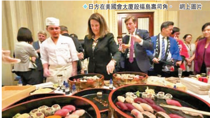
◆日方在美國國會大廈設福島壽司角。網上圖片

香港文匯報訊 日本一意孤行排放福島核污水，影響各方對日本海產的信心，中國更因此全面停止入口日本水產。日本方面為尋求外界支持，將壽司舞台搬到美國國會，現場即製手擱壽司可供40多名美國國會議員享用，試圖藉此增加外界對日本海產的信心。