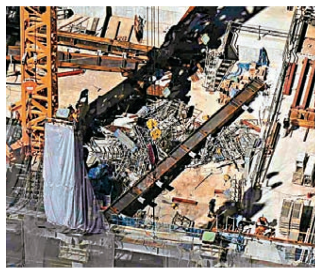
◆大量鋼架和鋼筋倒塌。網上圖片

地盤附近有民眾表示，事發時聽到一聲巨響，以為有車輛撞入建築物。另外一名附近餐廳的員工則說，他聽到金屬墜落聲音，但從未聽過如此大的巨響。警方正詳細調查事故原因。