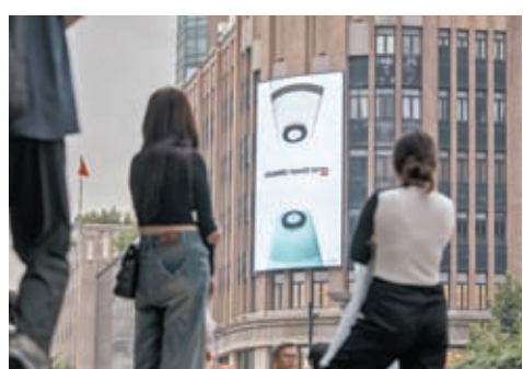
◆市場關注華為下週舉行的發布會。

銀行、保險、證券等大金融板塊積極護盤，石油、鋼鐵等板塊也飄紅。跌幅榜上，旅遊酒店板塊大幅回調3%，除長白山漲5%，板塊內其餘個股悉數收跌，西安飲食、曲江文旅暴跌6%。軟件開發、電子元件、計算機設備等科技板塊也走勢低迷。