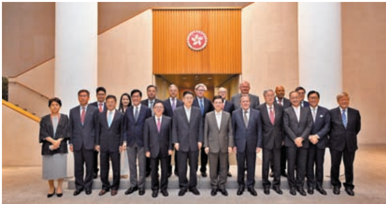
◆香港特首李家超（前排右六）19日與中投董事長彭純（前排左六）和國際諮詢委員會成員會面。

李家超指香港是世界上唯一一個匯聚全球優勢和中國優勢的城市，是內地通向國際金融市場和投資者的門戶。特區政府會繼續善用「一國兩制」下的獨特優勢，深化香港和內地資本市場的互聯互通，促進兩地之間的雙向資本流動，並繼續與金融監管機構和港交所緊密合作，將香港發展成更深更廣的融資平台，從而加強香港作為全球首屈一指金融中心的競爭力，同時為投資者提供更多元化的投資選擇。