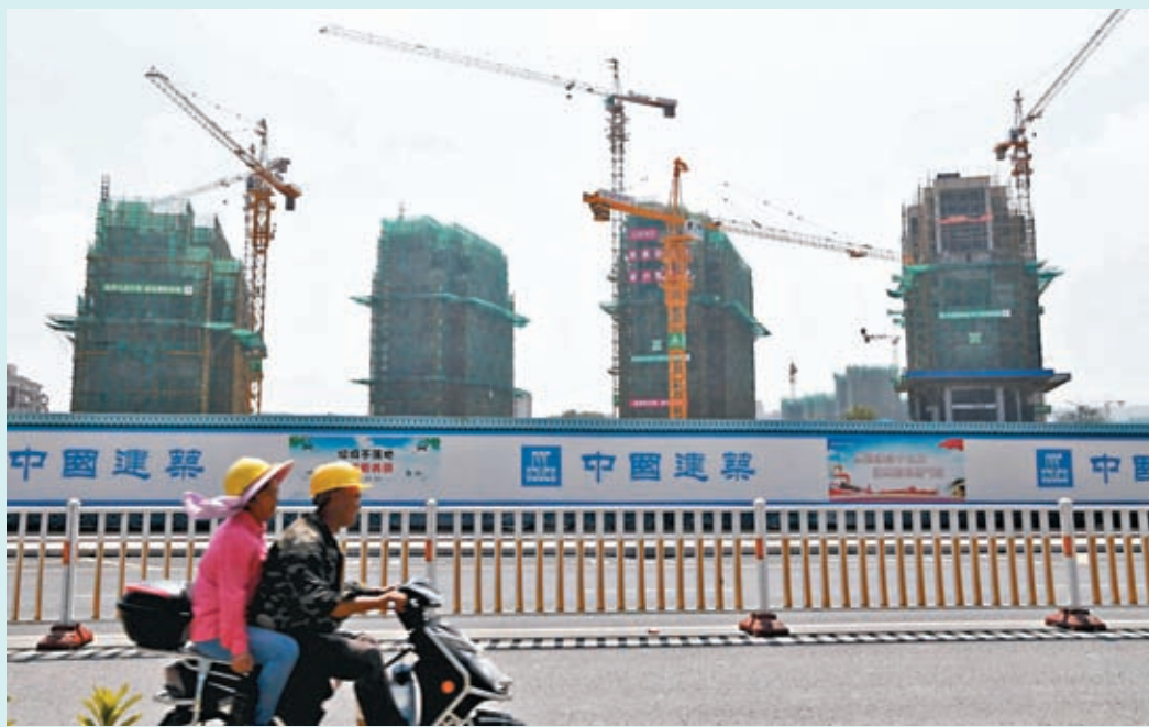
◆中國一二線城市已陸續調整樓市政策。

通知並稱，落實國家調整優化差別化住房信貸政策和降低存量首套房貸款利率政策，適時調整優化島內外首套和二套房商業性個人住房貸款最低首付比例和利率下限。