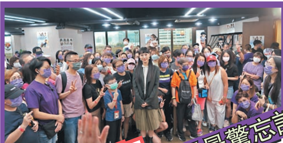
◆Gigi感謝一班粉絲很有心為她慶祝。