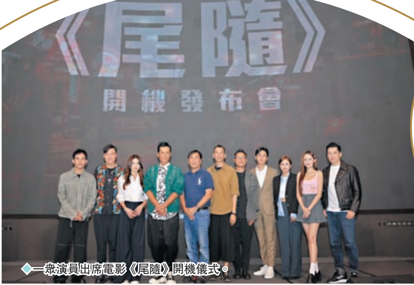
◆一眾演員出席電影《尾隨》開機儀式。

香港文匯報訊（記者 阿祖）動作懸疑電影《尾隨》，16日於吉隆坡開鏡，該片是天下電影公司在馬來西亞開發市場的第一步，由古天樂（古仔）、金馬男配角劉冠廷、周秀娜、黃浩然、楊德泳、張兆輝、馬來西亞演員黃詩棋（Yumi）、關德輝、培永等主演，並由第37屆金像獎提名新晉導演李子俊、《風林火山》編劇周汶儒共同執導，鄭保瑞監製，三人是繼《第八個嫌疑人》後再度合作，電影動員近百位大馬路演員及幕後工作人員，而拍攝場景會集中在吉隆坡市中心。電影《尾隨》16日在吉隆坡一間酒店舉行開鏡發布會，一眾演員出席開機儀式。古仔繼2016年到馬來西亞為電影《使徒行者》宣傳後，相隔七年再在大馬路開亮相，今次天下在大馬路的分公司正式成立的