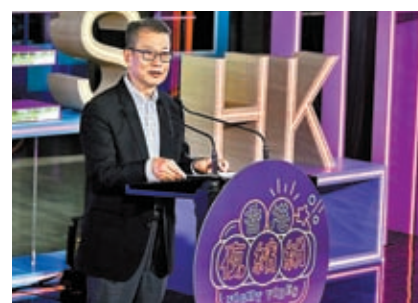
◆陳茂波日前在「香港夜繽紛」啟動禮致辭。資料圖片

除了「請客來」，陳茂波指還要積極「走出去」，親身向外國政商界介紹香港在金融、科技，以至其他範疇的新發展和新機遇，也希望藉這些機會釐清一些偏見和誤解。他前晚已啟程前往歐洲，開展一連十天的行程，分別到訪巴黎、倫敦、柏林和法蘭克福，包括出席