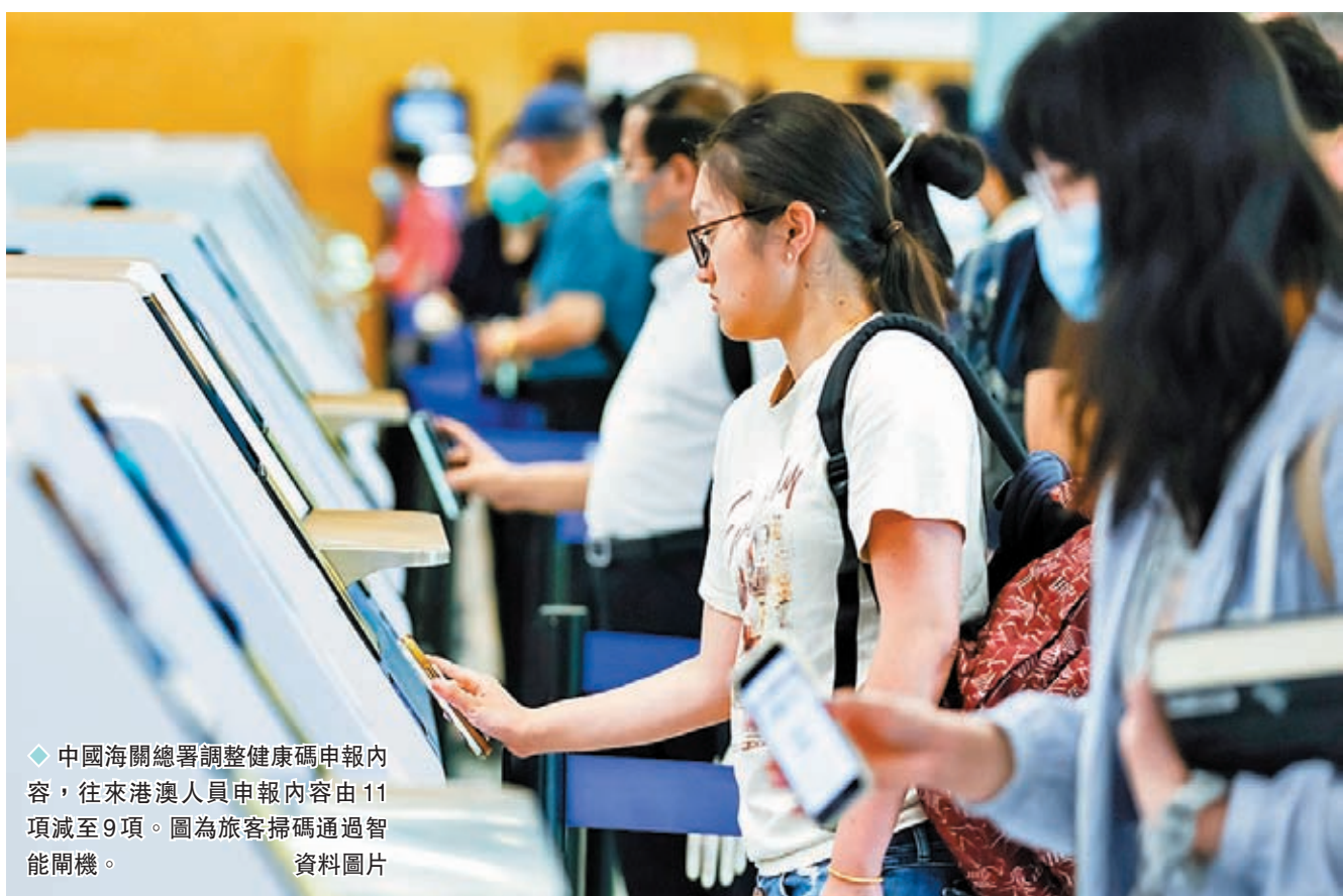
◆中國海關總署調整健康碼申報內容，往來港澳人員申報內容由11項減至9項。圖為旅客掃碼通過智能開機。資料圖片

不過，對於堅持健康申報制度，海關總署強調，健康申報是海關依據《中華人民共和國國境衛生檢疫法》實施的一項疫情防控制度，也是實現傳染病疫情早發現、早預防的重要手段。當前，新冠病毒還在不斷變異，猴痘、霍亂、登革熱、瘧疾、脊髓灰質炎、馬爾堡病毒