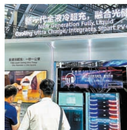
◆深圳市發布措施，便利北上港車在深充電。

根據規劃，2025年，深圳市將建設「超充站」300座，「超充/加油」數量比在國內率先達到1:1，初步建成「超充之城」；南方電網深圳供電局與華為數字能源技術有限公司聯合建設的南網首個全液冷超充示範站深圳福田會展中心建成，該站的投運吹響了深圳市打造世界一流「超充之