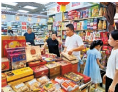
◆港人於深圳通過微信香港錢包支付數量較今年通關首月增7倍。圖為華強北一港貨商場。