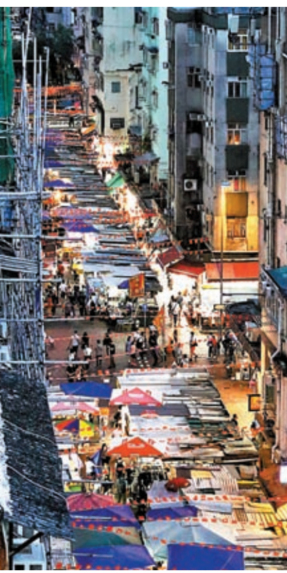
◆啟動「香港夜繽紛」系列是希望透過更多有主題和具特色的活動，讓市民有更多消閒或相約親友一起外出共聚的選擇。圖為深水埗夜市。

他希望是次訪歐行程能開拓更多務實的合作機會，「事實上，無論是綠色科技與綠色金融，人工智能或生命健康等，又或是第三代互聯網，都是香港與歐洲能加強協作發展的範疇。」他深信香港與國際市場的暢順銜接和緊密聯繫這獨特優勢，將可更好地為國家高質量發展發揮積極貢獻，同時亦實現自身更廣闊的發展。