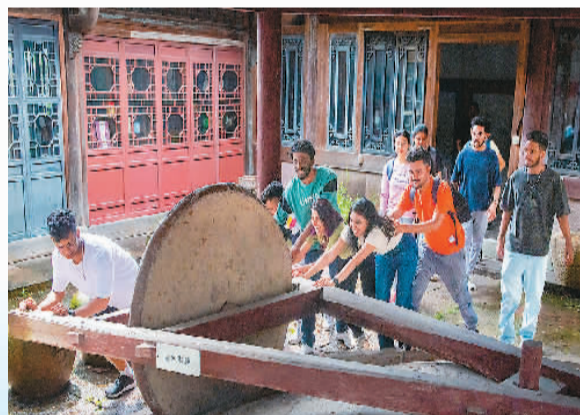
外国友人在耕泽石刻博物馆感受乡村民俗文化。