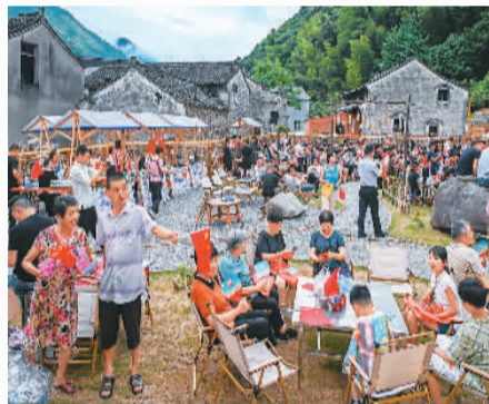
村民等待乡村音乐会开场。