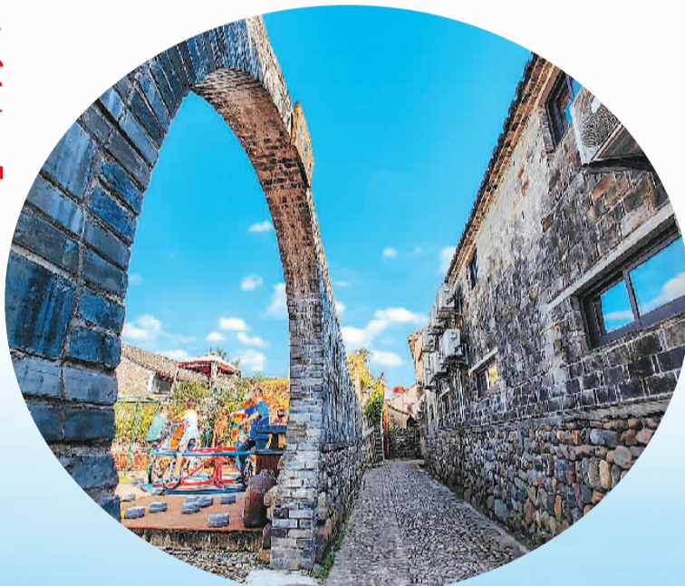
宁海河洪村的美丽庭院中，游客正在体验特殊的骑行运动。