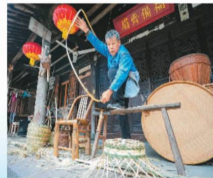
海曙李家坑村，村民向游客展示手工编织竹篮的传统技艺。