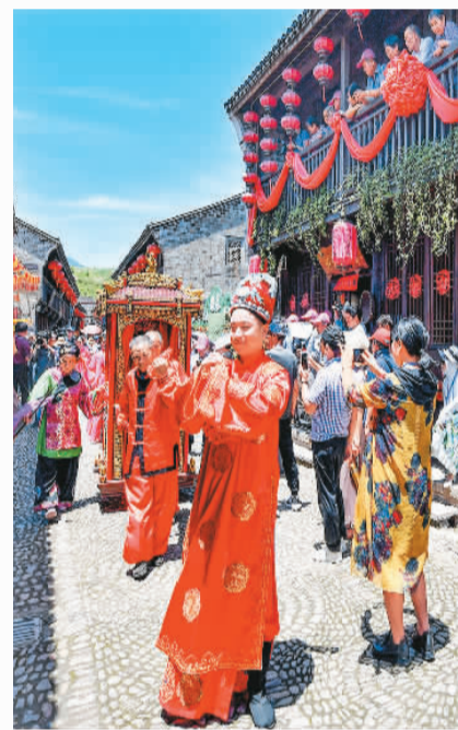
十里红妆大巡游在宁海前童古镇热闹上演。