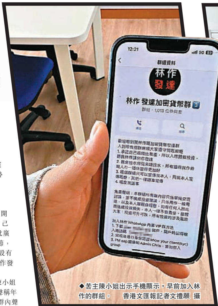
◆苦主陳小姐出示手機顯示，早前加入林作的群組。

該平台更「大小通吃」，連中學生也中招。在電腦節舉行期間，JPEX 的疑似合作夥伴在場內設攤位，並向身穿校服的中學生推銷，游說他們在JPEX 開戶投資虛擬貨