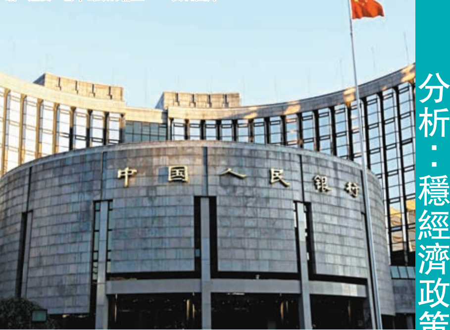
◆人民銀行通過官媒發聲稱，此次降準前瞻、適度、精準為銀行補血。

14日人民幣兌美元即期官方收升0.12%，報7.2701，創近兩周新高，不過在人民銀行公布降準之後，人民幣匯率偏軟。至14日晚21:48左右，人民幣兌美元在岸即期(CNY)報7.2804，人民幣兌美元離岸即期(CNH)報7.2918。