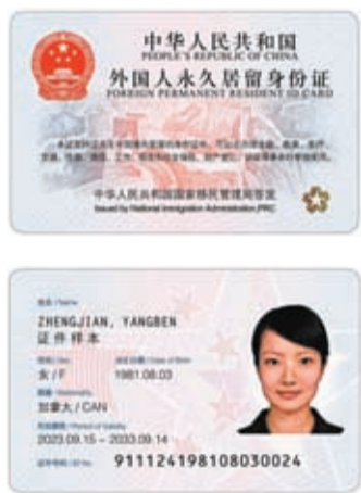
◆新版外國人永久居留身份證。

香港文匯報訊 據文匯網報道，中國國家移民管理局15日在京召開新聞發布會，宣布將於今年12月1日起正式簽發啟用新版外國人永久居留身份證（以下簡稱「永居證」），同時發布新版永居證式樣。新版永居證啟用後，現版永居證在有效期內仍可繼續使用，持證人可根據個人需要，適時申請換發新版永居證。