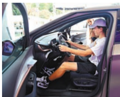
◆9月13日至17日，奧地利首都維也納舉辦電動汽車日活動。圖為觀眾在活動現場體驗一輛電動汽車。

「中國電動汽車的低價，並非依賴國家巨額補貼形成。」劉春生指出，中國對新能源汽車的財政補貼早已結束，進入完全由市場驅動階段。在多年政策推動、技術積累、生態營造的