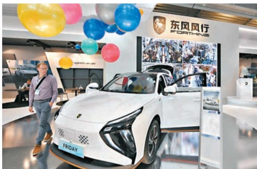
◆2023年德國國際汽車及智慧出行博覽會（慕尼黑國際車展）9月5日在慕尼黑開幕。圖為9月6日一名男子在德國慕尼黑國際車展的東風風行展區參觀。

發言人表示，中歐汽車產業有着廣泛的合作空間和共同利益，經過多年發展，早已形成「你中有我，我中有你」的格局。 發言人稱，中方敦促歐盟從維護全球產業鏈供應穩定以及中歐全面戰略夥伴關係的大局出發，與中方開展對話磋商，為中歐電動汽車產業共同發展創造公平、非歧視、可預期的市場環境，共同反對貿易保護主義，共同致力於全球應對氣候變化、實現碳中和的努力。中方將密切關注歐方保護主義傾向和後續行動，堅定維護中國企業的合法權益。