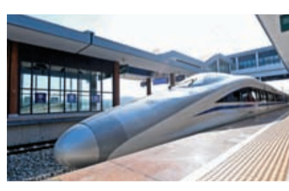
◆列車駛出福平鐵路平潭站。 資料圖片

國務院台辦副主任潘賢掌指出，「這份《意見》的貫徹實施，將為廣大台胞在福建學習、工作、生活盡可能提供最大空間、最好條件、最強保障，讓大家在最熟悉、最親切的環境中投資興業、安居樂業，享受主人一般的參與感、獲得感、幸福感和安全感。」