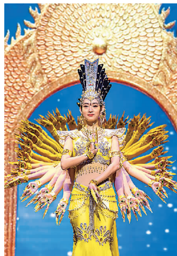
中国残疾人艺术团演员在重庆市特教中心举行的专场演出上表演舞蹈《千手观音》。