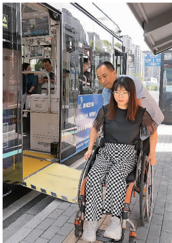
日前在江苏苏州的劳动路实验小学公交车站，公交车驾驶员协助坐轮椅的乘客乘坐无障碍公交车。