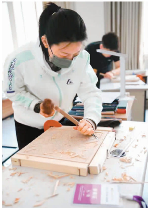
今年4月举办的陕西省残疾人职业技能竞赛吸引14个代表队243名选手参赛。图为参赛选手在雕刻比赛中。