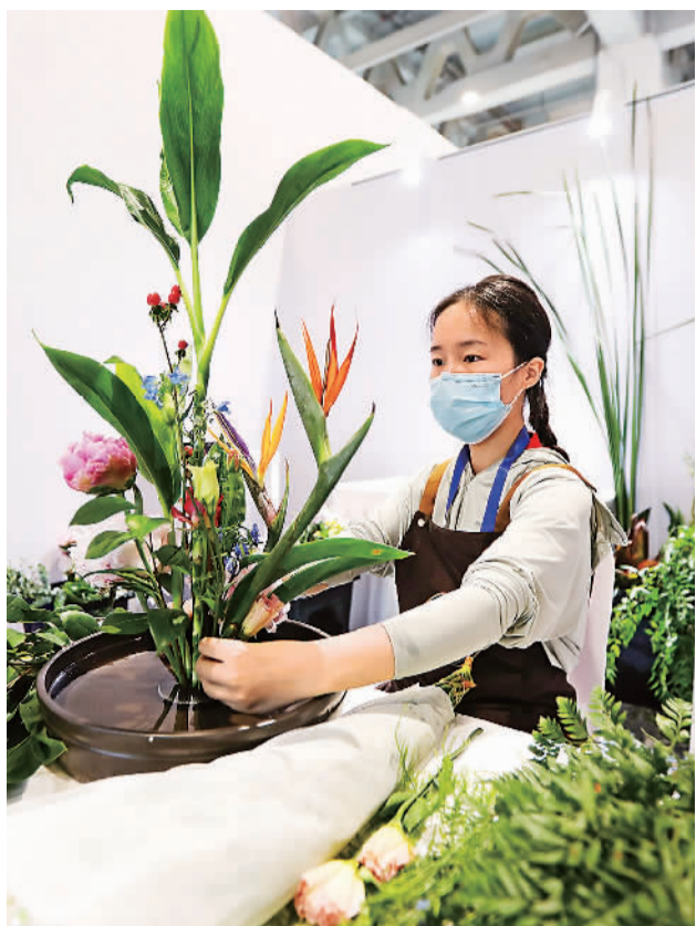
今年6月，在山东济南举办的第七届全国残疾人职业技能大赛上，参赛选手正在进行插花比赛。