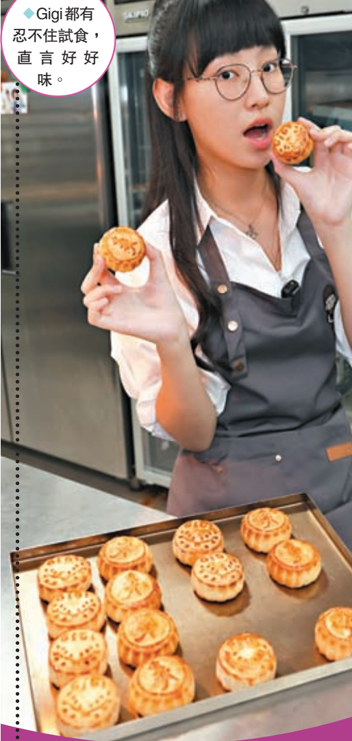
◆Gigi都有忍不住試食，直言好好味。

今次活動，由Gigi的歌迷會一手一腳籌劃，除了為慈善，同時為慶祝Gigi出道兩周年、於本月16日及17日舉行的「Gigi炎明熹出道2周年慶祝活動慈善義賣嘉年華」，當日除了會義賣月餅，還有Gigi親手繪畫的手繪布袋、演唱會簽名海報等限量精品，希望為流浪動物機構籌得更多善款。而歌迷會更精心地安排了一部爆谷機，恭賀Gigi兩場演唱會爆賣，Gigi表示亦會現身嘉年華幫手義賣：「嘅日好多第一次，第一次做月餅，第一次整爆谷畀自己同fans一齊食，但我唔敢食太多，因為要好好保護把聲，不過整爆谷好好玩，睇住佢爆開，心情原來會好興奮。其實最辛